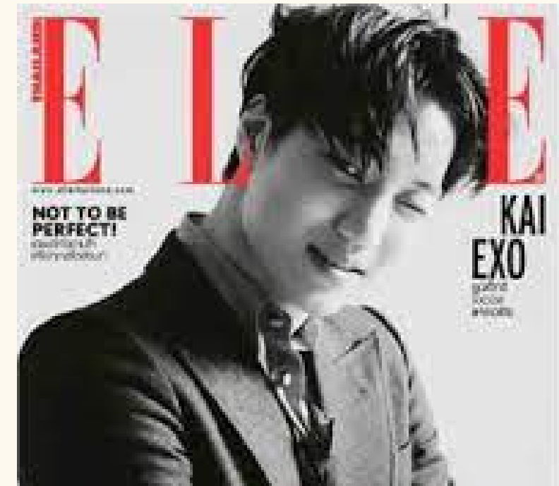
การจัดองค์ประกอบ