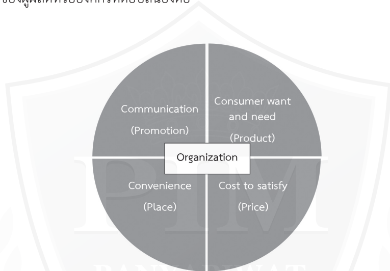
ภาพที่ 2 แสดงความสัมพันธ์ของส่วนผสมทางการตลาดแบบ 4P’s กับทิศทางกรบริโภคสินค้าในมุมมองของผู้บริโภคหรือ 4C’s (Lauterborn, 1990: 26)

มุมมองด้านพฤติกรรมผู้บริโภคของลูกค้าแบบ 4C’s ซึ่งประกอบด้วยสิ่งที่เป็นความจำเป็นหรือต้องการของผู้บริโภค (Consumer want and need) ราคาที่ผู้บริโภคพึงพอใจที่จะซื้อสินค้าหรือใช้บริการ (Cost to satisfy) ความสะดวกสบายในการซื้อ (Convenience to buy) และการสื่อสารโฆษณาและกลยุทธ์การส่งเสริมการตลาดที่ดี (Communication) (Lauterborn, 1990: 26)