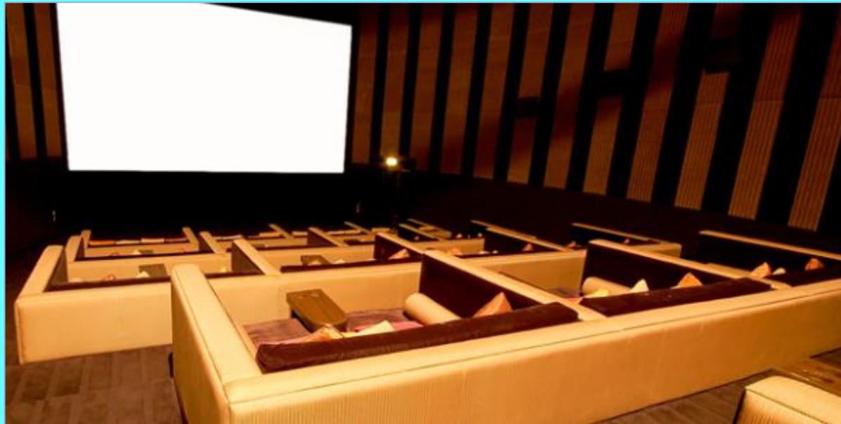
Enigma The Shadow Screen