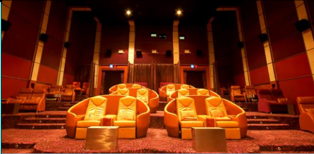
Bangkok Airway Blue Ribbon Screen – Paragon Cineplex