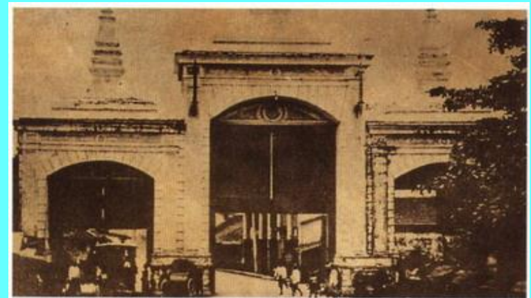
ประตูลานยอด ที่ตั้งของโรงละครหม่อมเจ้าอลังการ สถานที่ฉายหนังครั้งแรกในประเทศไทย ปัจจุบันไม่มีแล้ว กลายเป็นสี่แยกถนนเจริญกรุงตัดกับถนนมหาไชย