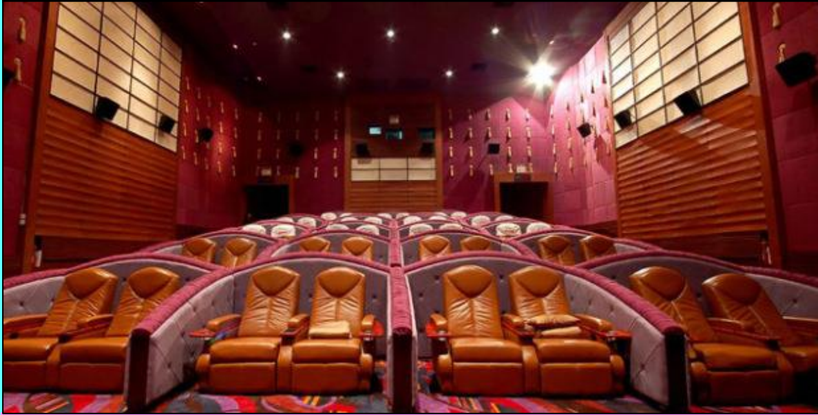
BSC Diamond Screen – Esplanade รัชดาภิเษก