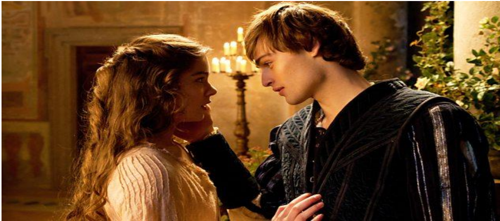
ภาพที่ 8.1 ละครประเภทโศกนาฏกรรม (Tragedy)