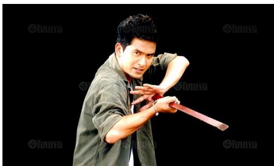
ภาพที่ 8.12 ละครการต่อสู้ (Action)

เป็นละครที่นำเสนอเรื่องราวการต่อสู้ระหว่างตัวเอกของเรื่องที่เป็นตัวแทนความดี ซึ่งมีความเก่งความกล้าหาญ เป็นวีรบุรุษผู้ปกป้องคุ้มครอง และตัวร้ายที่เป็นตัวแทนความชั่วร้าย มีความเก่ง ความกล้าในทางเลวร้ายและเป็นปฏิปักษ์ของตัวเอกเสมอ หัวใจสำคัญของเรื่องจะอยู่ที่ฉากการต่อสู้ระหว่างตัวเอกและตัวร้าย