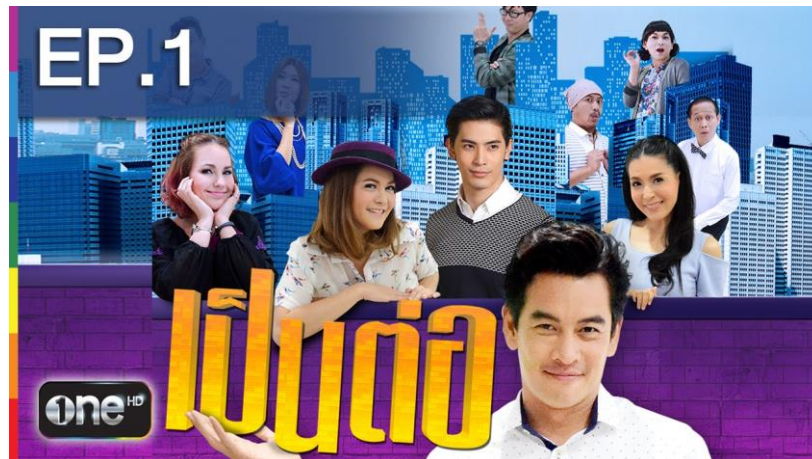
ภาพที่ 8.14 ภาพละครเรื่องยาว