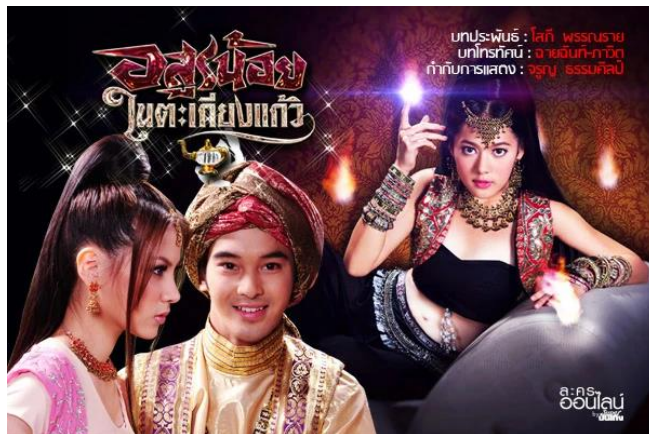
ภาพที่ 8.8 ละครแฟนตาซี (Fantasy)

เป็นละครที่นำเสนอเรื่องราวสุดจะเพ้อฝัน เน้นความสนุกสนานตื่นเต้นเกินความเป็นจริง เป็นเรื่องในจินตนิยายที่ผู้เขียนได้ผูกเรื่องราวขึ้นตามจินตนาการของตนเพื่อสร้างความสนุกสนานหรือเน้นความบันเทิงเรีงรมณ์