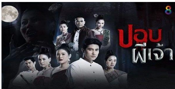
ภาพที่ 8.10 ละครลึกลับสยองขวัญ (Horror)

เป็นละครที่มีเรื่องราวเกี่ยวข้องกับความลึกลับบางประการที่ชวนให้ตื่นเต้น สยองขวัญ เกี่ยวข้องภูตผีปีศาจ วิญญาณลึกลับทั้งดีและร้าย รวมถึง เวทย์มนต์ คาถาอาคม