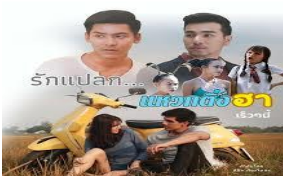
ภาพที่ 8.5 ภาพตัวอย่างละครตลกโปกฮา

ละครประเภทโปกฮา เป็นละครประเภทที่สร้างความขบขันจากเหตุการณ์ที่แปลกพิสดารหรือเกินความเป็นจริง ออกแนวอะอะตึ่งตึ่ง แต่ก็แฝงไว้ด้วยหลักปรัชญาที่ละเอียดอ่อน ไม่ต้อยไปกว่าละครประเภทอื่น มีจุดเด่นการสร้างความตลกให้แก่ผู้ชม