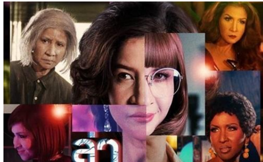
ภาพที่ 8.11 ละครฆาตกรรม (killer)

เป็นละครที่นำเสนอเรื่องราวมรณกรรมของบุคคลที่เกิดขึ้นจากการถูกวางแผนฆาตกรรม ดำเนินเรื่องให้น่าติดตามอย่างตื่นเต้นว่า ตัวละครจะรอดพ้นจากการเป็นเหยื่อได้หรือไม่ ใครจะเป็นเหยื่อรายต่อไป และใครจะหยุดฆาตกรได้ด้วยวิธีการใด