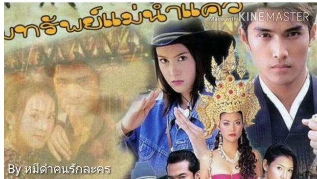
ภาพที่ 8.9 ภาพละครแนวผจญภัย

เป็นละครที่นำเสนอเรื่องราวการผจญภัยไปยังดินแดนที่เต็มไปด้วยเรื่องราวน่าพิศวง มีเหตุการณ์แปลกประหลาดสอดแทรกให้ตื่นเต้นระหว่างการเดินทาง ต้องเผชิญหน้ากับสิ่งที่ลึกลับแปลกใหม่ อย่างที่ไม่เคยเจอมาก่อน