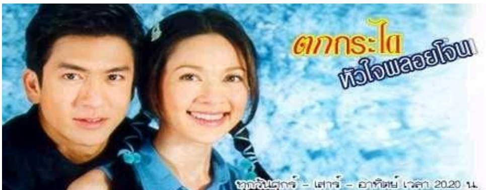
ภาพที่ 8.2 ละครตลกสุขนาฏกรรม (Romantic Comedy)

เป็นละครที่นำเรื่องราวเกินความคาดหมายแต่ก่อให้เกิดความตลก เช่น ละครเรื่อง ตกกะไดหัวใจลอยโจร หรือ เรื่อง นอตติ้ง ฮิลล์ (Notting Hill)