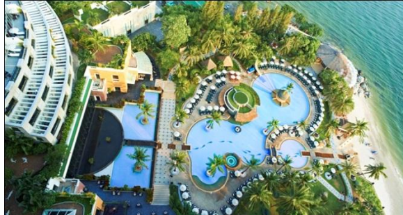
ภาพที่ 2.2 โรงแรมฮิลตัน หัวหิน

ในช่วงวันหยุดสุดสัปดาห์หรือหยุดพักร้อน เช่น โรงแรมอมารี พัทยา (Amari Pattaya) โรงแรมฮิลตัน หัวหิน (Hilton Hotel Hua Hin) เป็นต้น