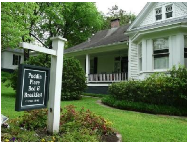
ภาพที่ 2.10 ที่พักประเภท Bed & Breakfast