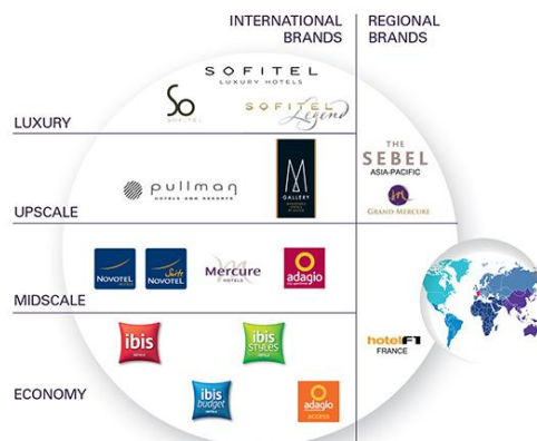
ภาพที่ 2.12 โรงแรมในเครือ Accor

4.2) Accor Hotels เป็นเครือโรงแรมของฝรั่งเศสแห่งเดียวในประเทศไทยมายาวนานกว่า 40 ปี เป็นเครือโรงแรมเดียวที่มีส่วนแบ่งครอบคลุมทุกกลุ่มเป้าหมายทางการตลาด ตั้งแต่โรงแรมระดับ 5 ดาว ไปจนถึงโรงแรมราคาประหยัด 3 ดาว อีกทั้งยังมีบูติก โฮเทล (Boutique Hotel) แแบรนด์โรงแรมในเครือ Accor Hotels ที่นิยมในประเทศไทยคือ Sofitel So, Sofitel, M Gallery, Pullman, Grand Mercure, Novotel, Mercure, Ibis, Ibis Style