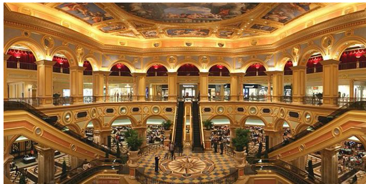
ภาพที่ 2.7 โรงแรมคาสิโน

โรงแรมคาสิโนหรือโรงแรมเพื่อการพนัน ถือได้ว่าเป็นโรงแรมที่มีการก่อตั้งแตกต่างจากโรงแรมประเภทอื่น ๆ เนื่องจากจุดประสงค์หลักในการสร้างโรงแรมประเภทนี้ เพื่อการบริการในการเล่นการพนัน การบริการห้องพักให้แขกจึงกลายเป็นจุดประสงค์รอง โรงแรมคาสิโนดึงดูดแขกผู้เข้าพักด้วยการพนันและกิจกรรมบันเทิง จะมีบริการอาหารชั้นเลิศ มีการแสดงบนเวทีจากนักร้อง นักแสดง ผู้มีชื่อเสียง เช่น โรงแรมคาสิโนในนครลาสเวกัส (Las Vegas) บางโรงแรมอาจมีการประสานงานจัดเที่ยวบินแบบเช่าเหมาลำเพื่อนำแขกเข้ามาใช้บริการเล่นการพนันและเข้าพัก ส่วนเกมสการพนันในโรงแรมประเภทนี้จะเปิดให้บริการแบบไม่มีวันหยุดตลอดทั้งปี ซึ่งการดำเนินงานบริหารจึงต้องมีการหมุนเวียนพนักงานเป็นกะอย่างเหมาะสม โรงแรมประเภทนี้บางแห่งอาจมีขนาดใหญ่มาก มีห้องพักแขกถึง 4,000 ห้องอยู่ในอาคารหลังเดียวกัน