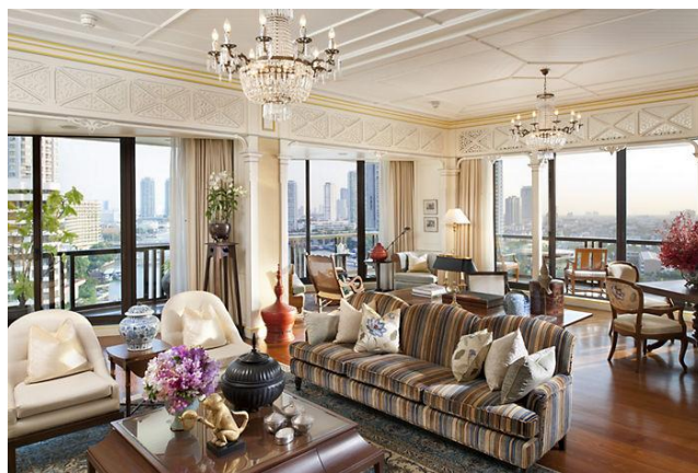
ภาพที่ 2.6 ลักษณะห้องชุดโรงแรมโอเรียลเตล

โรงแรมห้องชุดเป็นรูปแบบที่เพิ่งพัฒนาขึ้นมาเป็นรูปแบบใหม่ของธุรกิจโรงแรม ซึ่งมีการเจริญเติบโตและเป็นที่ยอมรับมากในอุตสาหกรรมที่พัก โรงแรมห้องชุดนี้จะมีห้องนอนและห้องรับแขกหรือห้องนั่งเล่น โดยห้องรับแขกนั้นจะแยกออกจากห้องนอน บางแห่งอาจมีห้องครัวเล็ก ๆ แต่ไม่อนุญาตให้ประกอบอาหารหรืออนุญาตให้ประกอบอาหารแบบง่าย ๆ โรงแรมแบบห้องชุดนั้นจะมีพื้นที่สาธารณะและสิ่งอำนวยความสะดวกน้อยกว่าโรงแรมทั่วไป มีต้นทุนต่ำ ทำให้สามารถตั้งราคาห้องพักได้ต่ำกว่าเมื่อเปรียบเทียบกับโรงแรมประเภทอื่น โรงแรมประเภทนี้จะได้รับความนิยมจากแขกหลากหลายกลุ่ม เช่น นักธุรกิจ หรือผู้ที่ต้องการมาพักผ่อนเพราะมีความเป็นส่วนตัว อีกทั้งผู้ที่ต้องเดินทางบ่อย ๆ เพราะเมื่อพักโรงแรมประเภทนี้จะทำให้มีความรู้สึกเหมือนพักผ่อนอยู่กับบ้าน