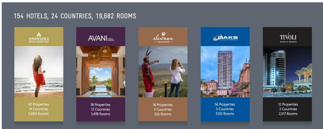
ภาพที่ 2.15 โรงแรมในเครือ Minor

4.5) Minor Hotels ไมเนอร์ โฮเทลส์ดำเนินธุรกิจโรงแรมและเซอร์วิส สวีท ทั้งในรูปแบบเป็นเจ้าของ บริหารจัดการ และร่วมลงทุน โดยมีโรงแรมในเครือทั้งสิ้นกว่า 520 แห่ง และมีจำนวนห้องพักรวมกว่า 75,000 ห้อง ภายใต้เครื่องหมายการค้าอนันตรา, อวานี, โอ๊คส์, ทิวาลี, เอเลวาน่า, เอ็นเอช คอลเลคชั่น, เอ็นเอช โฮเทลส์, นาว, แมริออต, โพรซีชั่นส์, เซ็นต์ รีจิส, เรดิสัน บลู และโรงแรมในกลุ่มไมเนอร์ อินเตอร์เนชั่นแนล ปัจจุบัน ไมเนอร์ โฮเทลส์มีกลุ่มโรงแรมและสปาในเครือใน 55 ประเทศทั่วภูมิภาคเอเชียแปซิฟิก ตะวันออกกลาง แอฟริกา คาบสมุทรอินเดีย ยุโรป และอเมริกา นอกจากนี้ ไมเนอร์ โฮเทลส์ยังเป็นผู้ประกอบการธุรกิจอื่น ๆ ที่เกี่ยวข้องกับธุรกิจโรงแรม ได้แก่ ธุรกิจศูนย์การค้าและบันเทิง ธุรกิจพัฒนาโครงการที่อยู่อาศัยเพื่อขาย และโครงการพักผ่อนแบบปันส่วนเวลา ประวัติ ไมเนอร์ ฟู้ดก่อตั้งขึ้นโดย วิลเลียม เอ็ดลั้วด์ ไฮเน็ค (บิล ไฮเน็ค) ในปี พ.ศ. 2523 ด้วยการเปิดตัวร้านพิซซ่าแห่งแรกของบริษัทในประเทศไทย ในปี 2523 ไมเนอร์ ฟู้ดได้รับสิทธิบริหารจัดการแฟรนไชส์ร้าน ไอศกรีมชื่อดังอย่างสเวนเซนส์จากซาน ฟรานซิสโก โดยในปัจจุบันสเวนเซนส์มีสาขาในประเทศไทยถึง 330 สาขาด้วยกัน