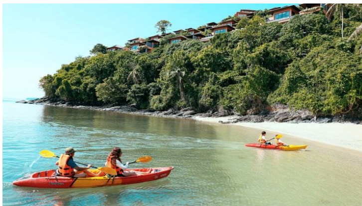
ภาพที่ 2.5 กิจกรรมพายเรือคายัค ศรีพันวารีสอร์ท

ริมทะเล โรงแรมที่ติดกับสถานที่เล่นสกีบนภูเขาหรือในป่า เป็นต้น โรงแรมประเภทนี้จึงจำเป็นต้องมีสิ่งอำนวยความสะดวกครบครัน มีบริการทั้งอาหารเครื่องดื่ม กิจกรรมทางการกีฬา เช่น ล่องแก่ง เดินป่า สกีภูเขา และยังมีบริการเสริมในด้านอื่น ๆ เช่น ห้องสมุด อินเทอร์เน็ต ห้องฟิตเนส เป็นต้น ที่พักประเภทรีสอร์ทนี้จะมีแขกเข้าพักมากในช่วงฤดูท่องเที่ยว (High Season) และจะมีแขกน้อยในบางฤดูกาล (Low Season) เช่น รีสอร์ทในป่าหรือริมทะเลจะมีแขกเข้าพักลดลงในช่วงฤดูฝน เช่น โรงแรมศรีพันวา ภูเก็ต อนันตรารีสอร์ท เชียงใหม่ เป็นต้น