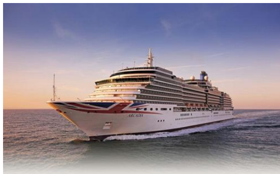
ภาพที่ 2.8 ที่พักประเภทเรือสำราญ (บริษัทอคาเดีย)