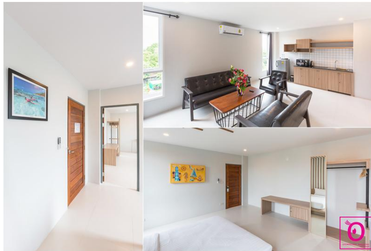
ภาพที่ 2.23 ที่พักประเภทโพซเต็ล