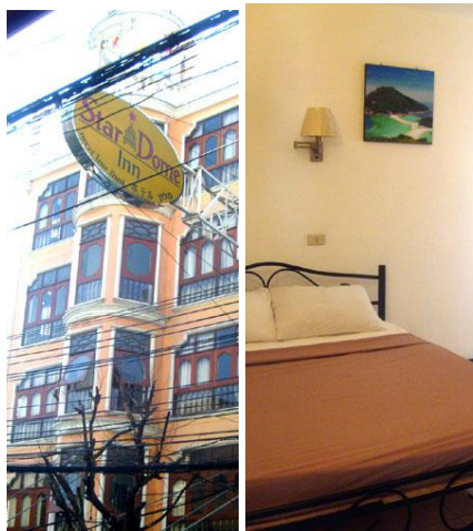
ภาพที่ 2.17 ที่พักประเภทเกสต์เฮาส์

เกสต์เฮาส์มีลักษณะเป็นบ้านพักที่เจ้าของอาจจัดแบ่งส่วนหนึ่งส่วนใดของที่พักไว้บริการนักท่องเที่ยว หรืออาจมีลักษณะไม่ต่างกับโรงแรม แต่มีการบริการและกฎระเบียบไม่เข้มงวดเหมือนโรงแรม เกสต์เฮาส์ มีการคิดค่าบริการค่าบริการ 2 แบบ คือ แบบที่มีอัตราค่าบริการสูง จะมีบริการสิ่งอำนวยความสะดวกในห้องพัก เช่น ห้องน้ำ โทรศัพท์ ส่วนแบบที่มีอัตราค่าบริการต่ำ จะไม่มีสิ่งอำนวยความสะดวกสบายเท่าที่ควร เช่น ไม่มีโทรศัพท์ในห้อง ไม่มีห้องน้ำส่วนตัวต้องใช้ห้องน้ำร่วมกับแขกอื่น ๆ