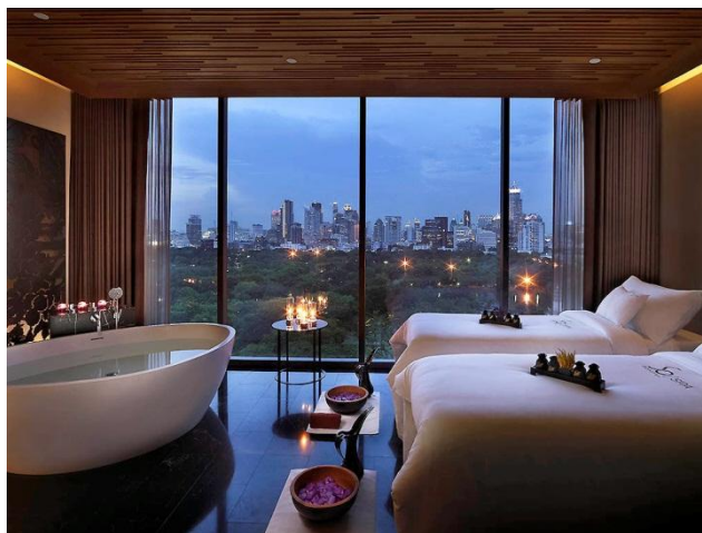
ภาพที่ 2.1 โรงแรมโซฟิเทล โซ

เป็นโรงแรมที่มักจะตั้งอยู่ในเมืองใหญ่ การคมนาคมสะดวก กลุ่มลูกค้าเป้าหมายคือนักธุรกิจที่ต้องเดินทางมาติดต่อกิจการเป็นหลัก โรงแรมในเมืองส่วนใหญ่จึงมีสิ่งอำนวยความสะดวกเพื่อการติดต่อธุรกิจและการจัดการประชุมสัมมนาต่าง ๆ เพื่อเอื้อต่อผู้เข้าพัก และอาจมีกลุ่มนักท่องเที่ยวที่ต้องการท่องเที่ยวในสถานที่สำคัญต่าง ๆ และสามารถจับจ่ายสินค้าได้ตามห้างสรรพสินค้าและร้านค้าใจกลางเมือง นักท่องเที่ยวที่เดินทางตามเทศกาลวันหยุดและวันสำคัญ ตัวอย่างโรงแรมในเมือง เช่น โรงแรมโซฟิเทล โซ (Sofitel So Hotel) บนถนนสาทร โรงแรมสยามเคมเปนสกี (Siam Kempinski Hotel) ถนนพระราม 1 เป็นต้น