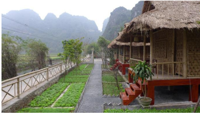
ภาพที่ 2.20 ที่พักประเภทฟาร์มสเตย์