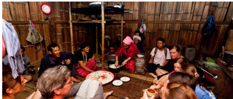
ภาพที่ 2.19 ที่พักประเภทโฮมสเตย์

ที่พักประเภทโฮมสเตย์นั้น เป็นบ้านพักของชาวบ้านในท้องถิ่นนั้น ๆ เปิดบริการให้ชาวต่างชาติหรือนักท่องเที่ยวจากพื้นที่อื่น ๆ ได้เข้าพักอาศัย มีกิจกรรมให้แก่ผู้ที่เข้าพักได้เรียนรู้วิถีชีวิตพื้นบ้านและวัฒนธรรมของชาวบ้าน เช่น การทำอาหารและรับประทานอาหารพื้นบ้าน การร่วมทำงาศิลปหัตถกรรมพื้นถิ่น การรับประทานอาหารด้วยมือ เป็นต้น ส่วนฟาร์มสเตย์เป็นที่พักที่เจ้าของฟาร์มหรือสวนเปิดให้นักท่องเที่ยวได้เข้าพักเพื่อต่อ ยอดการเรียนรู้กิจกรรมภาคการเกษตร ทั้งการเพาะปลูกพืช ผัก ผลไม้ ข้าว เรื่องปศุสัตว์ เช่น ฟาร์มโคนม ฟาร์มแกะ แพะ เป็นต้น โดยผู้เป็นเจ้าของที่พักหรือเจ้าบ้านทั้งโฮมสเตย์และฟาร์มสเตย์จะดูแลให้บริการผู้เข้าพักเสมือนเป็นแขกผู้มาเยี่ยมเยือน ให้ความเป็นกันเอง และได้สัมผัสวิถีชีวิตของคนในพื้นที่มากกว่าเข้าพักในโรงแรมหรือที่พักประเภทอื่น ๆ