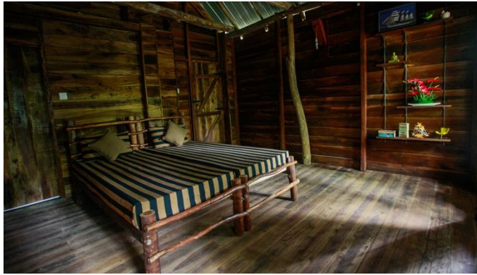
ภาพที่ 2.18 ที่พักเชิงนิเวศ