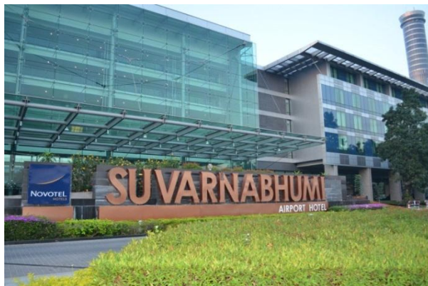
ภาพที่ 2.3 โรงแรมโนโวเทล สุวรรณภูมิ

เป็นโรงแรมที่ตั้งอยู่ใกล้ท่าอากาศยานหรือสนามบิน เหมาะสำหรับนักท่องเที่ยวหรือผู้โดยสารของสายการบินต่าง ๆ ที่มีเวลาน้อย เพราะต้องเดินทางต่อไปยังสถานที่อื่น ผู้โดยสารที่พลาดสายการบิน หรือแวะพักในช่วงเปลี่ยนผ่านเครื่องบิน รวมทั้งเป็นที่นิยมของพนักงานสายการบิน เนื่องจากตั้งอยู่ใกล้สนามบินและมีความสะดวกสบายในการเดินทางอีกด้วย เช่น โรงแรมโนโวเทล สุวรรณภูมิ โรงแรมอมารี แอร์พอร์ต เป็นต้น