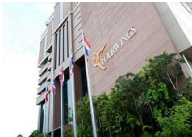
ภาพที่ 2.4 โรงแรมแกรนด์ โฟร์วิงส์

คือโรงแรมส่วนใหญ่ที่ไม่ได้จัดอยู่ในทั้ง 3 ประเภทที่กล่าวมาข้างต้น มักจะตั้งอยู่ตามชานเมืองแต่ไม่ห่างไกลตัวเมืองมากนัก และมีการเดินทางเข้าเมืองได้อย่างสะดวกสบาย ผู้เข้าพักสามารถเดินทางเพื่อติดต่อธุรกิจ หรือท่องเที่ยวตามสถานที่ท่องเที่ยวต่าง ๆ กลุ่มเป้าหมายของโรงแรมประเภทนี้มักเป็นแขกที่ต้องการหนีความแออัดในตัวเมือง เช่น โรงแรมแกรนด์โฟร์วิงส์ โรงแรมรามาร์คาร์เดนท เป็นต้น