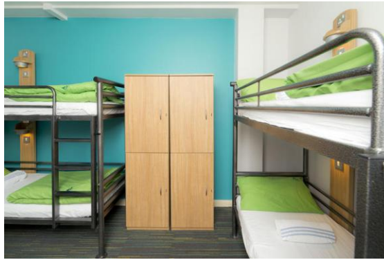
ภาพที่ 2.9 ที่พักประเภทโฮสเทล

11.5) บริการห้องพักและอาหารเช้า (Bed and Breakfast) ที่พักที่ให้บริการห้องพักและอาหารเช้า รู้จักกันในชื่อที่คุ้นหูสั้น ๆ ว่า Bed and Breakfast หรือ B&B ที่พักประเภทนี้มีห้องพักจำนวนไม่มาก ส่วนใหญ่เจ้าของกิจการจะนำบ้านหรืออาคารขนาดเล็กมาดัดแปลงเป็นที่พัก ดังนั้นจึงมีห้องพักเพียงไม่กี่ห้องเท่านั้น และเจ้าของกิจการก็อาศัยอยู่ในที่พักด้วย พนักงานที่ให้บริการอาจเป็นเจ้าของกิจการหรือเครือญาติ มีบริการอาหารเช้าให้โดยที่เจ้าของกิจการจะเป็นผู้ให้บริการด้วยตนเอง แต่อาหารมื้ออื่น ๆ จะไม่มีให้บริการ บางแห่งอาจจะต้องใช้ห้องน้ำร่วมกับแขกคนอื่น ๆ ด้วย ค่าที่พักต่อคืนนั้นจะย่อมเยากว่าโรงแรมหรือที่พักประเภทอื่น B&B มักจะตั้งอยู่ตามชนบทห่างไกลจากตัวเมือง เป็นที่นิยมในหมู่นักเดินทางที่อยากสัมผัสวิถีความเป็นอยู่ในชนบทและนักเดินทางที่มีงบประมาณจำกัด จุดเริ่มต้นของโรงแรมประเภทนี้เริ่มจากทวีปยุโรป โดยตั้งอยู่ริมทางระหว่างเมืองต่าง ๆ ต่อมาได้ขยายความนิยมไปยังประเทศสหรัฐอเมริกา ออสเตรเลีย