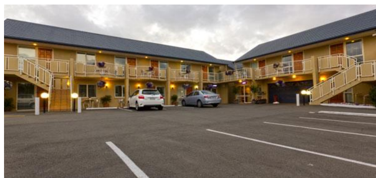
ภาพที่ 2.22 โมเต็ล

โรงแรมริมทางหลวงเป็นที่พักสำหรับผู้ขับขี่รถยนต์ได้แวะพักผ่อนระหว่างการเดินทาง เนื่องจากการเดินทางด้วยรถยนต์ยังเป็นที่ยอมรับและมีความสะดวกสบายไม่แพ้การเดินทางประเภทอื่น ๆ สะดวกทั้งเดินทางติดต่อทางการค้าและการท่องเที่ยวพักผ่อน ทำให้เกิดการพัฒนาและขยายตัวของกิจการที่พักตามเส้นทางถนน โดยมักถูกเรียกหรือเป็นที่รู้จักกันว่า “โมเต็ล” (Motel) เกิดขึ้นครั้งแรกหลังสมัยสงครามโลกครั้งที่สอง ที่ประเทศสหรัฐอเมริกาและยังเป็นที่นิยมจนถึงปัจจุบัน ลักษณะเป็นอาคารชั้นเดียวขนาดเล็ก พร้อมทั้งจอดรถบริเวณติดกันหรือหน้าห้องพัก ที่ผู้เข้าพักสามารถจอดรถหน้าประตูห้องพักและเปิดเข้าออกได้โดยไม่ต้องผ่านประตูห้องโถงต้อนรับส่วนหน้า โมเต็ลส่วนใหญ่จะมีจำนวนห้องน้อยและมักตั้งอยู่ตามริมถนนชานเมือง ต่อมาในสมัยปัจจุบันเริ่มมีการพัฒนาไปเป็น โมเต็ลที่มีขนาดใหญ่ขึ้น มีอาคารขนาด 2-3 ชั้น เพิ่มเติมบริการด้านอาหาร มีห้องนั่งเล่นให้บริการเครื่องดื่มและของว่าง บางแห่งอาจมีสระว่ายน้ำ ห้องประชุม ให้บริการอีกด้วย ทั้งยังมีโทรศัพท์ภายในห้องพัก ซึ่งกลายเป็นลักษณะทั่วไปของโมเต็ล