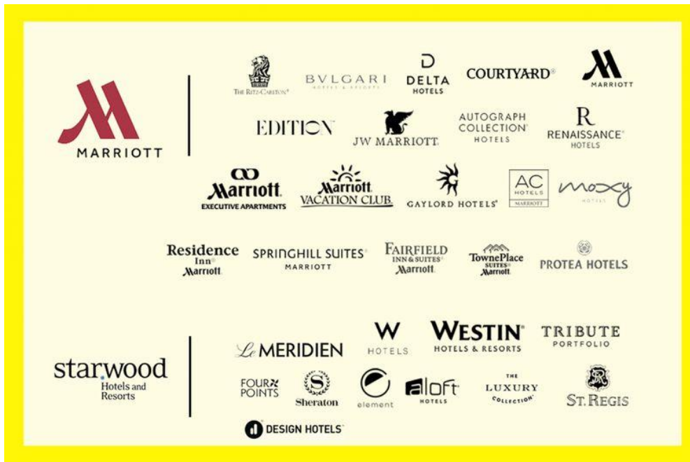
ภาพที่ 2.11 Marriott International