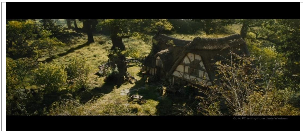
ภาพที่ 6.15 ภาพถ่ายจากมุมสูง

หมายถึง ภาพที่มีลักษณะถ่ายจากที่สูงลงมา เช่น ถ่ายจากเครื่องบิน เครื่องร่อน อาคารสูง หรือเครนถ่ายภาพ