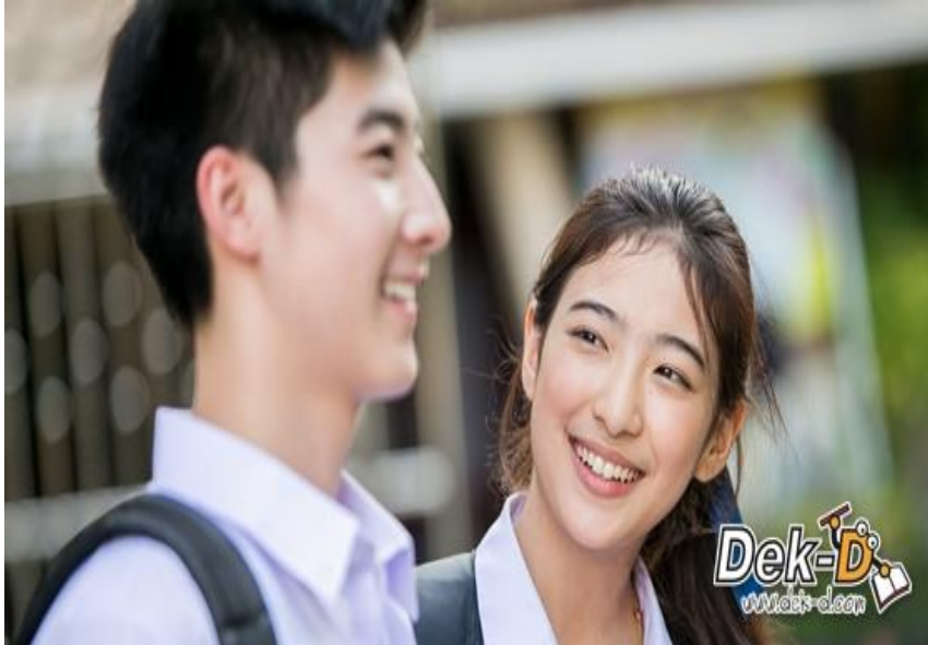
ภาพที่ 6.5 ระยะห่างระหว่างเพื่อน

ก็จะแตกต่างกัน ระยะห่างระหว่างอาจารย์สนทนากับนักศึกษา ก็จะแตกต่างจากการสนทนากับเพื่อน หรือ การพูดกับพระก็จะเว้นระยะห่างพอสมควรมากกว่าการพูดกับบุคคลธรรมดา