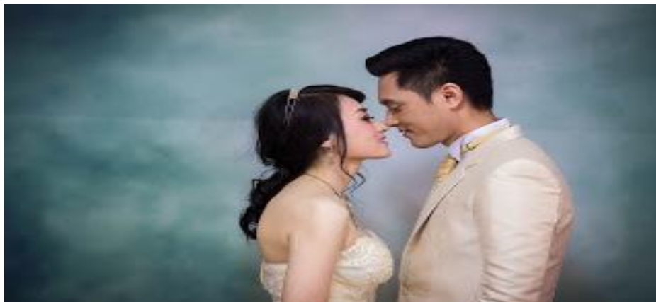
ภาพที่ 6.11 ภาพระยะปานกลาง

ใช้คำย่อว่า MS หมายถึง ภาพระยะปานกลาง เป็นการกำหนดขนาดภาพให้เห็นรายละเอียดมากขึ้น แต่ยังคงสภาพของฉากหรือภาพรวมของสถานที่ไว้ได้