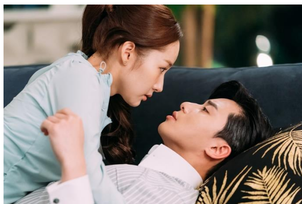
ภาพที่ 6.3 แสดงการใช้วัจนภาษาทางสายตา

สายตาตามนุษย์นั้น สามารถสื่อสารอารมณ์ภายในได้หลากหลายเช่นเดียวกับใบหน้า และมักจะแสดงออกควบคู่กับใบหน้าเสมอ เช่น การวิงวอนด้วยสายตา การมองค้อนด้วยความน้อยใจ การส่งสายตาหวานซึ่งถึงคนรัก หรือการแสดงความโกรธทางสายตา หรือแม้แต่การควบคุมสถานการณ์ในการสนทนาด้วยการใช้สายตา เช่น การมองสบตาคู่สนทนาเพื่อสื่อให้เห็นความตั้งใจฟัง การมองด้วยสายตาอ่อนโยนเพื่อสื่อให้เห็นความเป็นมิตรหรือความเป็นกันเอง