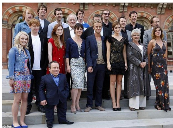
ภาพที่ 6.23 ภาพหมู่

หมายถึง ภาพที่ถ่ายได้จากการรวมกลุ่มคนเข้าอยู่ในกรอบภาพเดียวกัน