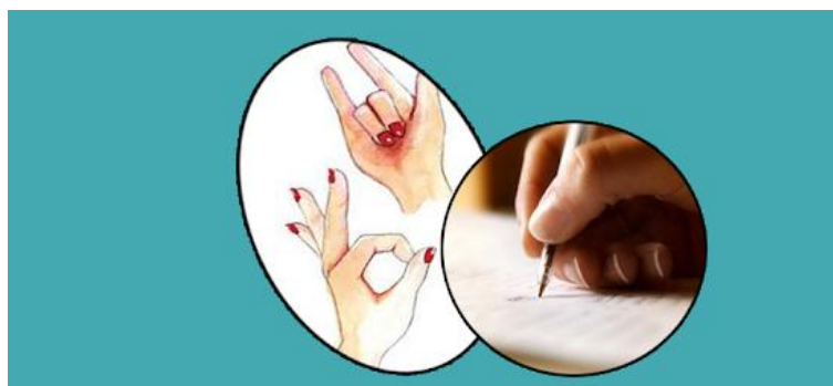
ภาพที่ 6.1 แสดงตัวอย่างการใช้อวัจนภาษา

การแสดงท่าทางนี้ได้แก่ การเคลื่อนไหวร่างกายหรืออวัยวะส่วนใดส่วนหนึ่งเพื่อสื่อความหมาย เช่น การผงกศีรษะ การส่ายหน้า การโบกมือ การแสดงท่าทางประกอบคำพูด