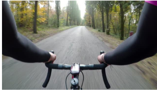
ภาพที่ 6.28 ภาพมุมในสายตาของผู้แสดง

หมายถึง มุมที่ถ่ายโดยกล้องอยู่ในตำแหน่งผู้แสดงและเปรียบเสมือนผู้แสดงโดยตรง ซึ่งภาพจะแสดงให้เห็นฉากสิ่งของต่าง ๆ ที่ผู้แสดงเห็น จะทำให้เกิดความรู้สึกประหนึ่งว่าผู้ชมเองได้มีส่วนร่วมในการแสดงหรือรู้สึกเป็นผู้แสดงเสียเอง