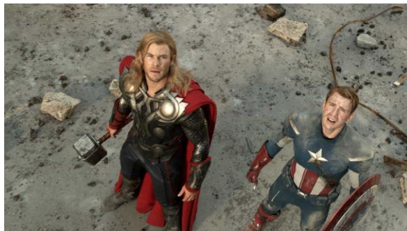
ภาพที่ 6.25 ภาพมุมสูง

หมายถึง การกำหนดตำแหน่งกล้องไว้สูงกว่าวัตถุที่จะถ่าย เลนส์กล้องจะกดลงตามที่ผู้เขียนบทกำหนด มุมกล้องแบบนี้จะใช้สื่อความเป็นจริงตามเหตุการณ์ที่เกิดขึ้นในฉาก เช่น ผู้แสดงมองลงจากที่สูง หรือใช้สื่ออารมณ์ความรู้สึกต่ำต้อย อยู่ภายใต้ความครอบงำ