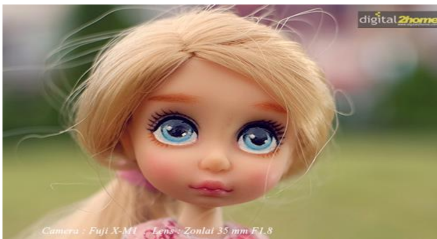
ภาพที่ 6.13 ภาพระยะใกล้

ใช้คำย่อว่า CU หมายถึง ภาพระยะใกล้ เป็นการกำหนดขนาดภาพให้เห็นรายละเอียดมาก ต้องการเน้นให้เห็นรายละเอียดในสิ่งที่ถูกถ่ายทำเป็นพิเศษ