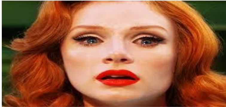
ภาพที่ 6.16 ภาพที่ถ่ายในระยะใกล้มาก

หมายถึง ภาพถ่ายที่มีลักษณะใกล้มาก มีขนาดใหญ่ เช่น ภาพคนเต็มหน้า ภาพบางส่วนของใบหน้า ภาพดวงตา หรือเครื่องประดับบนศีรษะ