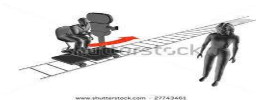
ภาพที่ 6.31 การดอลลี่ (Dolling)

หมายถึง การเคลื่อนกล้องติดตามความเคลื่อนไหวของสิ่งที่ถ่ายหรือฉาก มีระยะทางเป็นแนวตรงหรือแนวอ้อมเข้าหาหรือออกจากวัตถุที่ถ่าย (Dolly In หรือ Dolly Out) มีความคล้ายคลึงกับการซูม แต่จะมีมิติความรู้สึกของภาพและรายละเอียดขององค์ประกอบภาพมากกว่า มีมุมมองภาพที่หลากหลาย