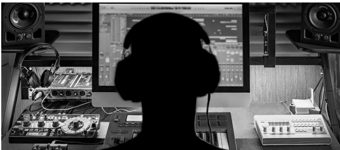
ภาพที่ 6.6 การตัดต่อ

หมายถึง การนำเรื่องราวแต่ละภาพแต่ละตอนที่ได้ถ่ายทำไว้มาคัดเลือกและจัดลำดับภาพให้สอดคล้องกัน สร้างความสัมพันธ์ขององค์ประกอบทั้งหมดของเรื่อง