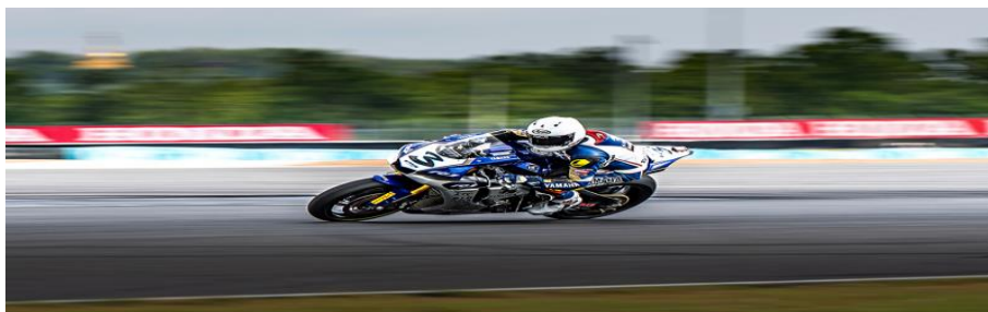
ภาพที่ 6.29 การแพน (Panning)

หมายถึง การเคลื่อนที่ของกล้องตามแนวนอนไปด้านซ้ายหรือขวา (pan left หรือ Pan Right) เพื่อให้เห็นภาพตามแนวกว้าง หรือเพื่อต้องการนำสายตาผู้ชมไปยังจุดที่น่าสนใจ จุดที่ต้องการเพื่อต้องการติดตามการเคลื่อนไหวของวัตถุ เพื่อให้เห็นการตอบโต้กัน หรือเพื่อต้องการเปลี่ยนฉาก