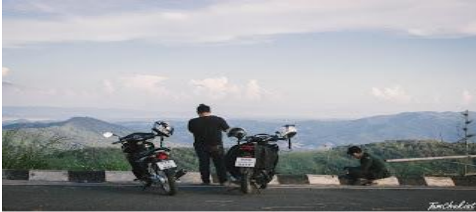
ภาพที่ 6.10 ภาพระยะไกล

ใช้คำย่อว่า LS หมายถึง ภาพระยะไกล เป็นการกำหนดขนาดภาพกว้าง แต่มีความกว้างน้อยกว่า ภาพ EL แสดงให้เห็นภาพรวมของฉากว่ามีอะไรเกิดขึ้นที่ไหน ในทิศทางใด และสิ่งที่เกิดขึ้นจะอยู่ในกรอบนั้น