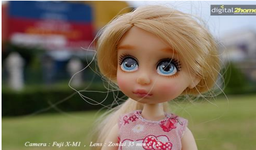
ภาพที่ 6.12 ภาพระยะใกล้ปานกลาง

ใช้คำย่อว่า MCU หมายถึง ภาพระยะปานกลางค่อนข้างใกล้ เป็นการกำหนดขนาดภาพให้เห็นรายละเอียดประมาณหนึ่งซึ่งมากกว่าภาพ MS