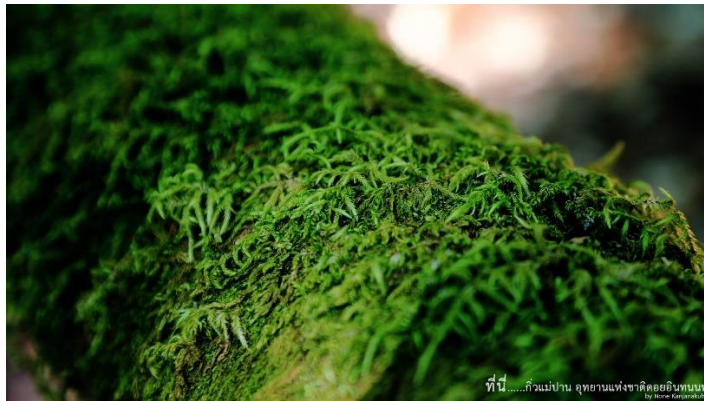
ภาพที่ 6.30 การซูม (Zooming)

หมายถึง การเปลี่ยนขนาดภาพให้ใหญ่หรือใกล้ขึ้น ให้เล็กหรือไกลออกไป (Zoom In หรือ Zoom Out) โดยมีจุดประสงค์ให้ผู้ชมสนใจวัตถุที่ถ่าย หรือให้เกิดความน่าตื่นตา