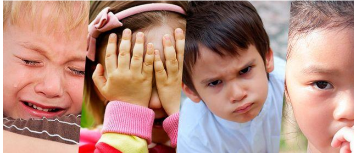
ภาพที่ 6.2 แสดงอารมณ์ความรู้สึกพื้นฐานที่แสดงออกบนใบหน้า

คนเรามีความสามารถสื่อสารผ่านทางใบหน้าได้ในหลายกรณีไม่ว่าจะเป็นดีใจ เสียใจ เศร้าใจ ตกใจ ตื่นเต้น เป็นสุข เป็นทุกข์ โกรธ หรือเฉยเมย ก็จะแสดงอารมณ์ผ่านทางสีหน้าได้อย่างชัดเจน