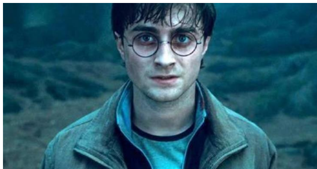
ภาพที่ 6.24 มุมกล้องระดับสายตา

หมายถึง การกำหนดตำแหน่งของกล้องในระดับเดียวกับสายตาของมนุษย์ ซึ่งจะทำให้ได้ความรู้สึกเป็นจริงตามสายตาที่มองเห็น ถ้ารายการใดเปิดภาพโดยใช้มุมกล้องนี้ หมายถึงว่าผู้เขียนบทต้องการให้ผู้ชมได้เห็นสภาพตามความเป็นจริง เป็นมุมกล้องที่ใช้แทนการเห็นโดยทั่วไปจึงมักจะถูกนำมาใช้เพื่อเดินเรื่อง