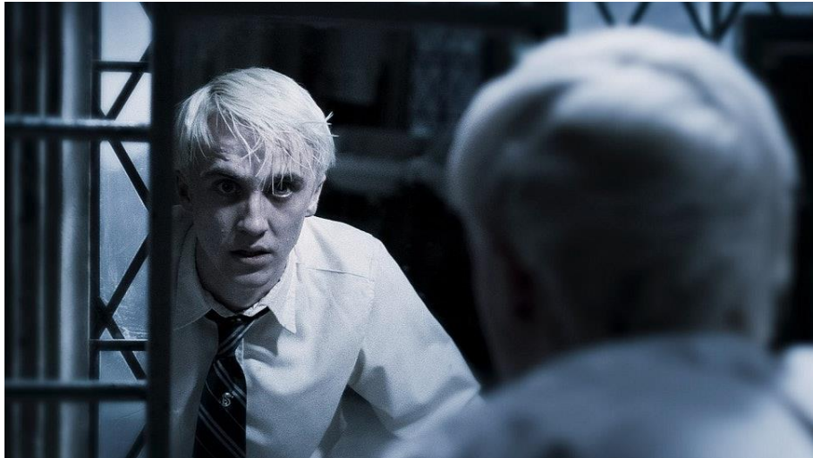
ภาพที่ 6.22 ภาพถ่ายจากกระจกเงา

หมายถึง ภาพที่ถ่ายเงาสะท้อนในกระจก ซึ่งในการเขียนบทต้องระบุให้ชัดเจนว่าเป็นภาพที่ต้องถ่ายจากกระจกเงา