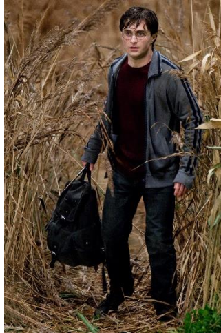
ภาพที่ 6.20 ภาพถ่ายเต็มตัว

หมายถึง ภาพผู้แสดงคนเดียวหรือกลุ่มคนเต็มตัว โดยมีฉากหลังประกอบด้วย