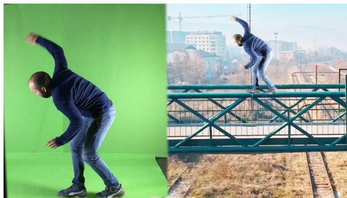
ภาพที่ 6.7 Chroma key effect

หมายถึง การซ้อนภาพโดยการกัตสีฉากพื้นหลังที่เป็นส่วนบลูสกรีน (Blue screen) ออกไปแล้วแทนที่ด้วยภาพอื่นที่ต้องการนำเสนอ สิ่งสำคัญคือห้ามวัตถุหลักที่อยู่หน้าฉากเป็นสีเดียวกับฉากหลังบลูสกรีนที่ต้องการคีย์ เพราะพื้นที่ที่เป็นบลูสกรีนจะถูกกัตสีออกไป เทคนิคนี้จะพบได้ ในรายการพยากรณ์อากาศ