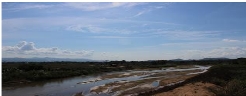
ภาพที่ 6.9 ภาพระยะไกลมาก

ใช้คำย่อว่า ELS หรือ XLS หมายถึง ภาพที่มีระยะไกลมาก เป็นการกำหนดขนาดภาพให้มีความกว้างมาก แสดงให้เห็นสภาพแวดล้อมโดยทั่วไปของสถานที่ วัตถุในภาพจะมีขนาดเล็ก มักใช้เมื่อต้องการนำเสนอภาพรวมของสถานที่