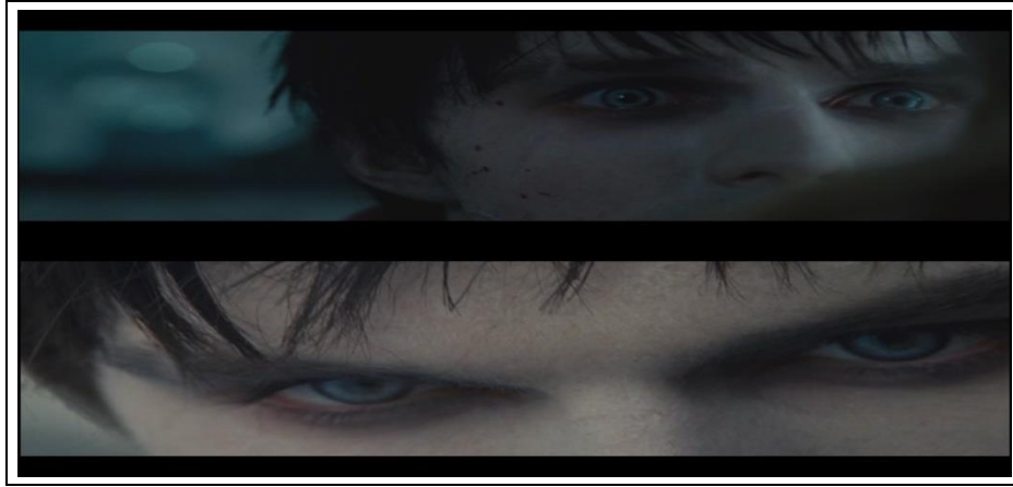
ภาพที่ 6.14 ภาพระยะใกล้มาก

ใช้คำย่อว่า ECU หมายถึง ภาพระยะใกล้มาก เป็นการกำหนดขนาดภาพ เพื่อให้เห็นรายละเอียดในส่วนใดส่วนหนึ่งของวัตถุอย่างชัดเจน