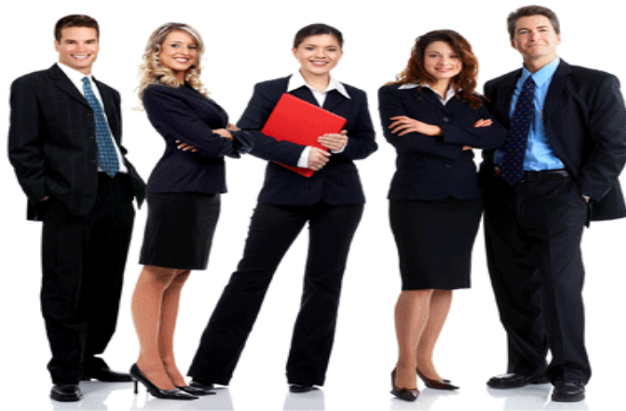
ภาพที่ 6.4 ภาพการแต่งกาย

เสื้อผ้า การแต่งกายสามารถสื่อถึงความเป็นตัวตนของบุคคลได้ เพราะเสื้อผ้าสามารถบอกถึงอายุ บุคลิก ทัศนคติ สถานภาพหรือแม้แต่บ่งบอกถึงความสำเร็จของบุคคลได้เช่นกัน ดังนั้น การสวมใส่เสื้อผ้าก็จัดเป็นอวัจนภาษาที่สำคัญประการหนึ่ง