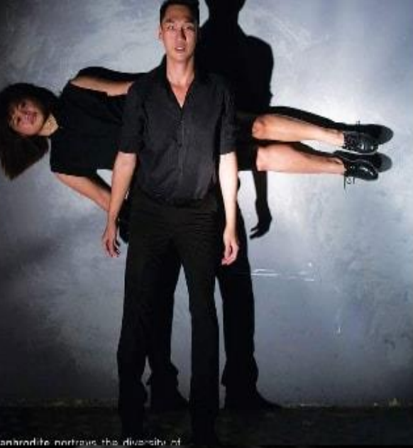
anahadite portrays the diversity of