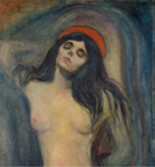
edvard munch : Madonna