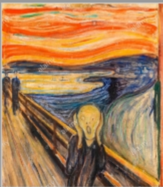
edvard munch the scream