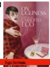
Ego Schiele Self-portrait with a woman

from Courbet > Foucault > Ego Schiele > U Eco NEO SUBLIME