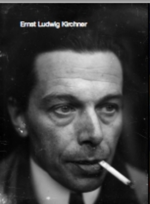
Ernst Ludwig Kirchner