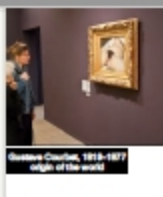
Gustave Courbet, 1818-1877 origin of the world