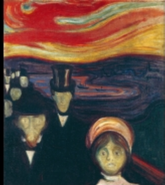
edvard munch : Anxiety