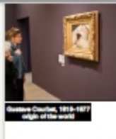
Gustave Courbet, 1818-1877 origin of the world