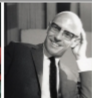
Michel Foucault (1926-1984)