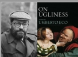
Umberto Eco (1902-2016)