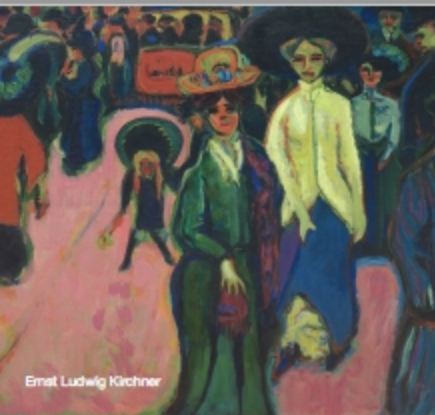
Ernst Ludwig Kirchner