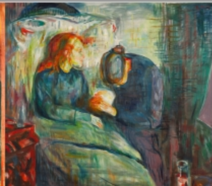
The Sick Child