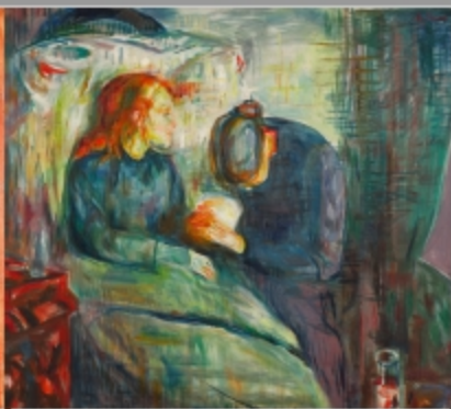
The Sick Child