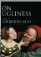
Umberto Eco (1932-2016)