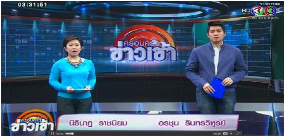
ภาพที่ 9.1 ภาพรายการข่าว

ข่าววิทยุโทรทัศน์นั้นสามารถเข้าถึงผู้ชมได้แก่ ประชาชนทั่วไปโดยไม่จำกัดความรู้ความสามารถในการอ่านออกเขียนได้ ทุกคนสามารถเข้าใจในเนื้อหาข่าวได้ด้วยการรับฟังและชมภาพเหตุการณ์ เพราะนอกจากจะรับรู้ทั้งภาพและเสียงของเหตุการณ์แล้วผู้อ่านข่าวยังได้อ่านสรุปให้อีกครั้ง ซึ่งทำให้เข้าใจเนื้อหาได้ด้วยเวลาสั้น ๆ