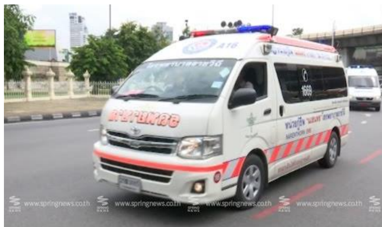
ภาพที่ 9.12 เสียงรถกู้ชีพ

เสียงสถานการณ์จริงหมายถึงเสียงที่เกิดขึ้นโดยธรรมชาติของสถานการณ์ เมื่อมีเหตุการณ์ใดขึ้นก็ย่อมจะมีเสียงของเหตุการณ์ด้วยเสมอ ไม่ว่าจะเป็นการเกิดอุบัติเหตุ น้ำท่วม หรือ การชุมนุมทางการเมือง เช่น เสียงอึกทึบครึกโครมเหตุการณ์น้ำท่วม เสียงโกลาหลในเหตุการณ์ไฟไหม้ เสียงไซเรนส์ของรถกู้ชีพ หรือรถดับเพลิง หรือเสียงอึกทึบในการชุมนุมทางการเมือง เป็นต้น