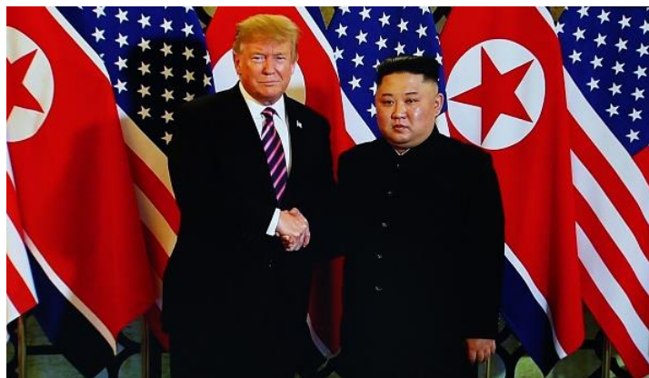
ภาพที่ 9.6 การพบปะกันระหว่างผู้นำประเทศ

หมายถึง เหตุการณ์ที่เกิดขึ้นนั้นมีความโดดเด่นเป็นพิเศษในตัวเอง ประชาชนส่วนมากให้ความสนใจ เช่น เหตุการณ์เครื่องบินตก การเสียชีวิตของนักร้องดัง ความเคลื่อนไหวของผู้นำระดับโลก ซึ่งเหตุการณ์ดังกล่าวมีผลกระทบต่อความรู้สึก ความสนใจของคนจำนวนมาก ดังนั้นจึงถือว่าเป็นเหตุการณ์ที่มีความเด่น สมควรนำมาเป็นข่าวเพื่อเสนอสู่สาธารณชน