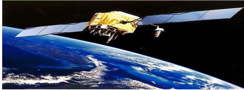
ภาพที่ 9.5 ภาพความก้าวหน้าด้านวิทยาการ

หมายถึง ความก้าวหน้าด้านวิทยาการ เทคโนโลยี หรือ การค้นพบสิ่งใหม่ ๆ เช่น การค้นพบวิธีการรักษาโรค การค้นพบระบบสุริยะหรือดาวดวงใหม่ และการส่งยานอวกาศเพื่อสำรวจนอกโลก เป็นต้น