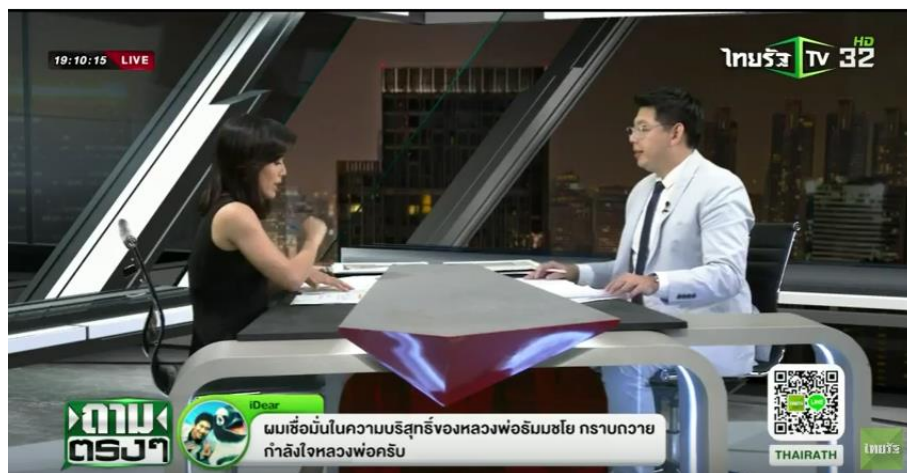
ภาพที่ 9.15 ภาพการสัมภาษณ์ข่าว

หมายถึง รายการที่นำเสนอข้อมูล ข้อเท็จจริง ของเหตุการณ์ต่าง ๆ ที่น่าสนใจ เป็นการนำเสนอความคิดเห็นผ่านการสัมภาษณ์จากผู้เกี่ยวข้องในเหตุการณ์ หรือบุคคลในข่าว โดยผู้ดำเนินรายการจะเป็นผู้สัมภาษณ์ หรือป้อนคำถาม รายการข่าวประเภทนี้ไม่มีบทให้อ่านบทก็จะเป็นเพียงประเด็นคำถามที่ได้เตรียมไว้ล่วงหน้า หรือผู้ดำเนินรายการคิดขึ้นในขณะนั้น