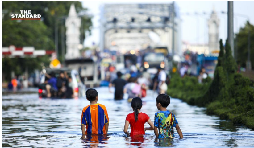
ภาพที่ 9.8 ภาพเหตุการณ์น้ำท่วม