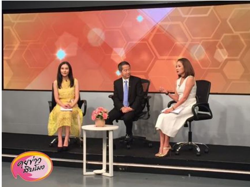
ภาพที่ 9.17 ภาพรายการสนทนาข่าว