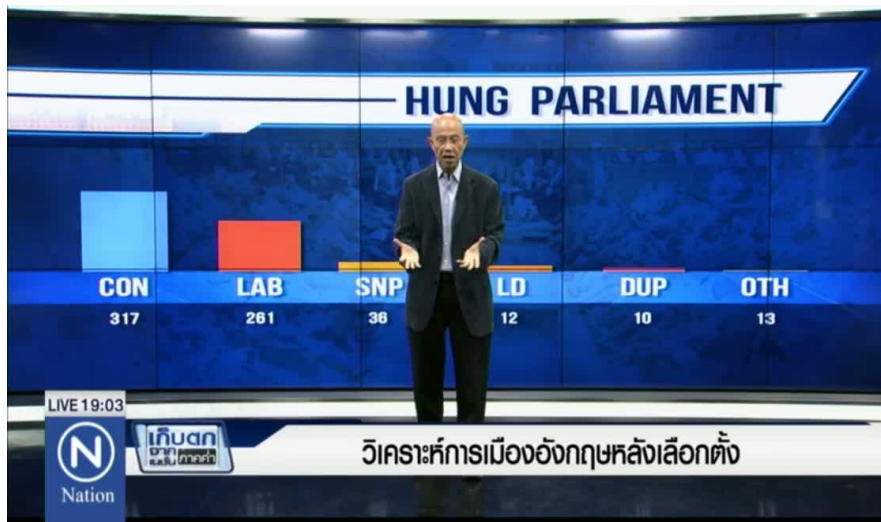
ภาพที่ 9.16 ภาพรายการวิเคราะห์ข่าว

หมายถึง รายการที่นำเสนอข่าวในลักษณะการนำเสนอประเด็นข่าวที่มีความสำคัญ มาวิเคราะห์ข้อมูลเบื้องต้นเบื้องหลังของเหตุการณ์ต่าง ๆ ที่เกิดเป็นข่าว ผ่านกระบวนการวิเคราะห์ เนื้อหาอย่างรอบด้าน มีรายละเอียดของข่าวมากกว่าข่าวปกติทั่วไป ผู้ที่ทำหน้าที่วิเคราะห์ข่าวจะต้องมี ข้อมูลเชิงลึก มีการวิเคราะห์ข้อมูลอย่างละเอียด เพื่อให้ผู้ชมได้รับความรู้เกี่ยวกับแง่มุมของข่าวนั้น ๆ เช่น เกิดเหตุได้อย่างไร ใครเสียประโยชน์ ใครได้ประโยชน์ ใครอยู่เบื้องหลังของเหตุการณ์ ใครได้รับ ประโยชน์จากเหตุการณ์ที่เกิดขึ้น หรือเมื่อเกิดเหตุอย่างนี้แล้วใครจะเป็นผู้รับผิดชอบ บุคคลหรือ หน่วยงาน จะมีวิธีการแก้ไขอย่างไรเพื่อไม่ให้เกิดเหตุการณ์เช่นนี้อีก การวิเคราะห์ข่าวนี้อาจจะเป็น ลักษณะการนำเสนอข้อมูลเชิงลึก แทรกด้วยข้อคิดเห็นของผู้วิเคราะห์ข่าวประกอบเป็นเนื้อหาสาระ ของรายการ ซึ่งผู้รับชมก็จะได้สาระความรู้ไปพร้อมกับการได้รับข่าวสาร