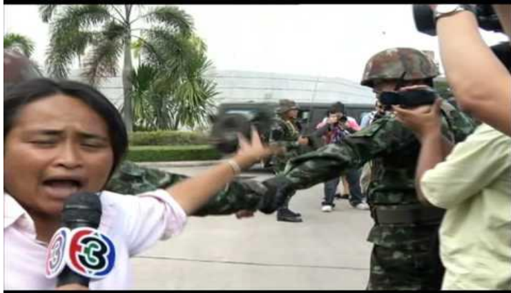
ภาพที่ 9.11 การรายงานข่าวจากสถานการณ์จริง

ที่มา https://www.facebook.com/DramaAdd/photos/a.411063588290/