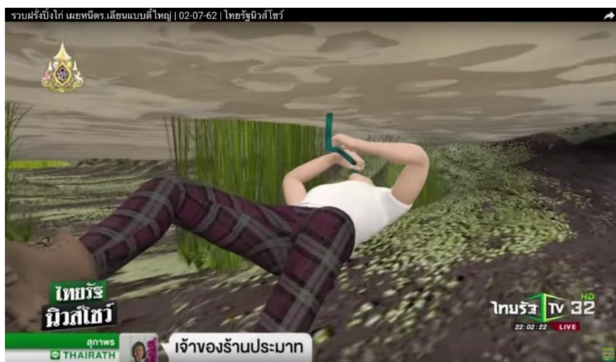
ภาพที่ 9.9 ภาพกราฟิกจำลองสถานการณ์จริง

ภาพกราฟิก คือภาพที่ได้จากการใช้โปรแกรมคอมพิวเตอร์สร้างขึ้น เพื่อประกอบรายการข่าวหรือเนื้อหาข่าวให้สมบูรณ์ น่าสนใจติดตาม มีหน้าที่บอกชื่อ ตำแหน่ง ประเด็น สถิติ หรือจำลองสถานการณ์จริง เช่น จำลองภาพอุบัติเหตุ แทนเหตุการณ์จริงที่ไม่สามารถกลับไปถ่ายได้