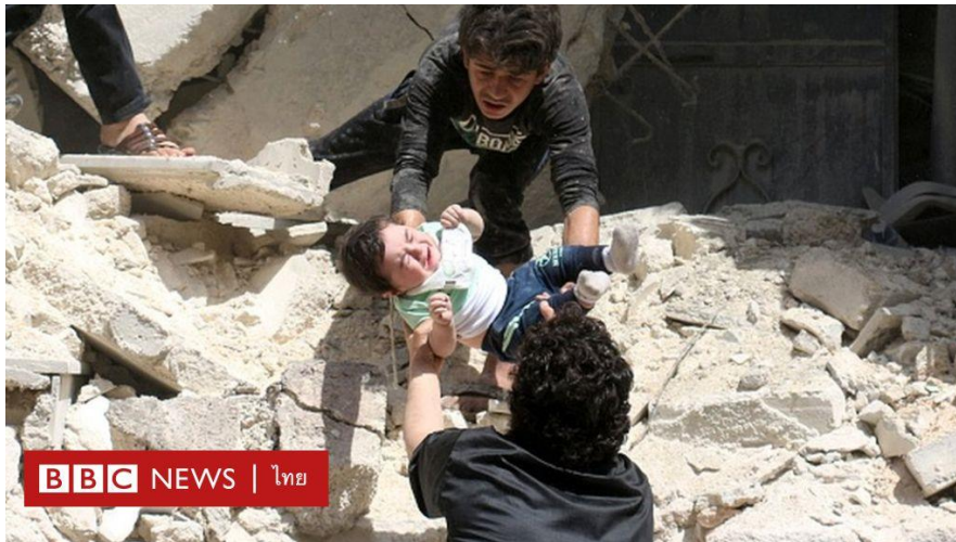
ภาพที่ 9.7 เด็กน้อยที่ได้รับผลกระทบจากสงคราม

เหตุการณ์ที่เกิดขึ้น โดยมีเรื่องเพศและวัยมาเกี่ยวข้อง เช่น เหตุการณ์ที่ผู้ก่อการร้ายที่ก่อเหตุเป็นผู้หญิง ผู้ประสบเหตุการณ์เป็นเด็ก หรือเรื่องราวของเด็กอัจฉริยะ ซึ่งเหตุการณ์เหล่านี้ย่อมเป็นที่น่าสนใจมากกว่าปกติ เพราะโดยปกติคนจะรับรู้ว่าการก่ออาชญากรรมส่วนมากจะเป็นผู้ชาย จึงถือว่าเป็นเหตุการณ์ที่น่าสนใจ สามารถนำมาเสนอเป็นข่าวได้