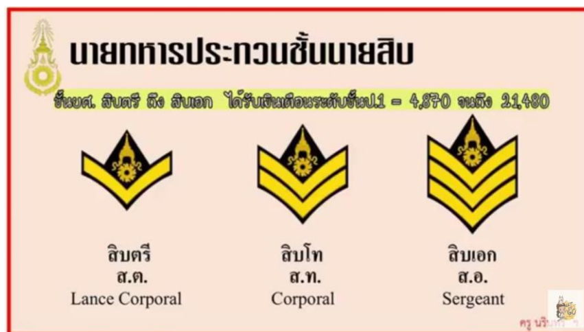
ภาพที่ 9.21 ตัวอย่างชั้นยศทหารบก

การระบุชื่อบุคคลจะต้องระบุให้ชัดเจน และถูกต้องทั้งชื่อ นามสกุล หากมียศ ตำแหน่ง หรือบรรดาศักดิ์ ก็ต้องเขียนให้ครบถ้วน ในกรณีที่ไม่เอ่ยถึงบุคคลที่มีตำแหน่งหรือบรรดาศักดิ์ ก็ให้ใช้สรรพนามที่เป็นบรรดาศักดิ์ หรือตำแหน่งแทน แต่ทั้งนี้ก็ต้องขึ้นอยู่กับความเหมาะสม