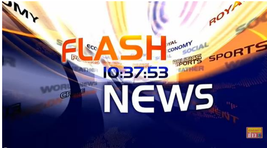
ภาพที่ 9.14 ภาพรายการข่าวสั้นหรือข่าวต้นชั่วโมง

ที่มา https://1th.me/MOOfQ , เผยแพร่เมื่อวันที่ 02 ก.พ. 58, สืบค้นเมื่อวันที่ 12 มิ.ย. 63