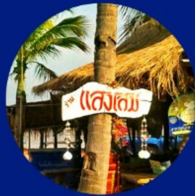
'ร้านอาหารแสงโสม' แซ่แควอร์