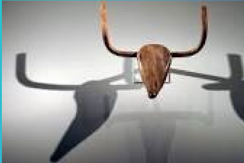
Bull's Head โดย ปิกัสโซ, 1942