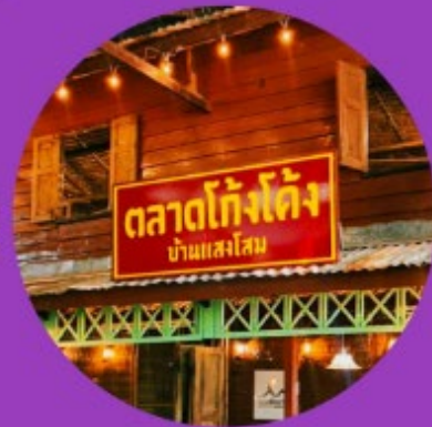
ตลาดยี่อุมยุค จุดเช็คอินเยาว์รุ่นอยุธยา