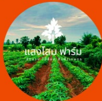
ฟาร์มต้นโงก 4.0 รัชชานนโธรพมยา