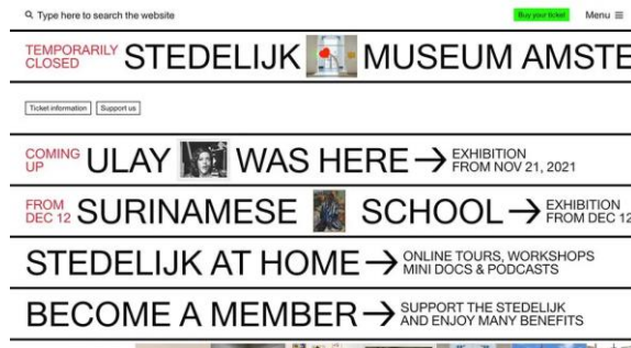
ภาพที่ 2.32 งานออกแบบกราฟิกด้านมัลติมีเดีย (Multimedia Graphics)

เป็นงานออกแบบ กราฟิกที่ประกอบสื่อหลากหลายสื่อ ไม่ว่าจะเป็นรูปภาพ ภาพเคลื่อนไหว เสียง ตัวอักษร การโต้ตอบ (Interactive) ได้แก่ งานออกแบบโต้ตอบ ภาพยนตร์ ภาพยนตร์โฆษณา การออกแบบเว็บไซต์ การออกแบบแอปพลิเคชัน เป็นต้น