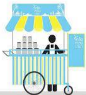
ประเภทช่องทางการจำหน่าย

มาบุญครอง กับ สยามเซ็นเตอร์ จะมีกลุ่มคนเดินที่ต่างออกไป และลักษณะสินค้าและ ราคาก็ไม่เหมือนกันด้วย ทั้งๆที่ตั้งอยู่ใกล้กัน ดังนั้นขายที่ใดก็ต้องพิจารณาตามลักษณะสินค้า