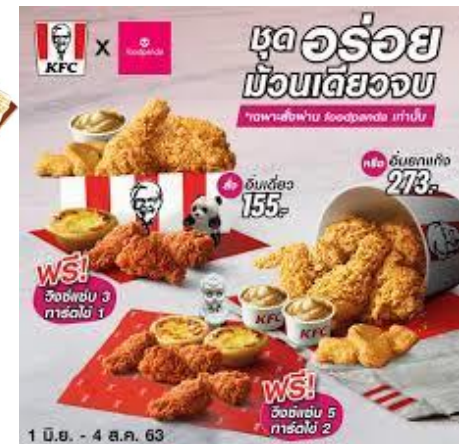
• ตัวอย่าง การขายอาหารเป็นชุดของบรรดาร้านฟาสต์ฟู้ด กระเช้าของขวัญช่วงเทศกาลชุดสังฆทานที่ขายตามห้าง ฯลฯ