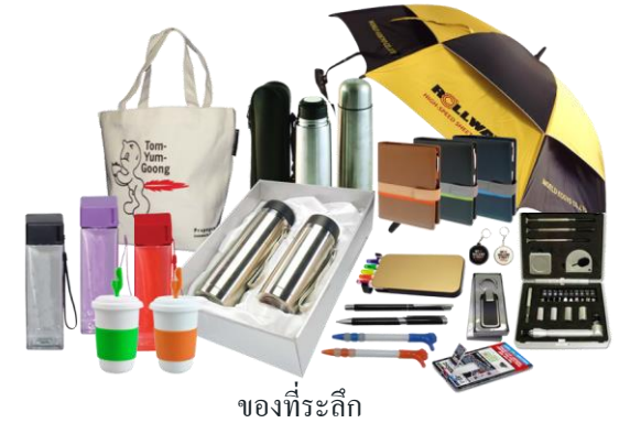
ของที่ระลึก

ความสวยงามก็คือหน้าที่ใช้สอยนั่นเอง และความสวยงามจะสร้างความประทับใจแก่ผู้บริโภคให้เกิดการตัดสินใจซื้อได้