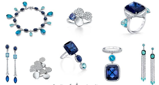
ผลิตภัณฑ์เครื่องประดับ