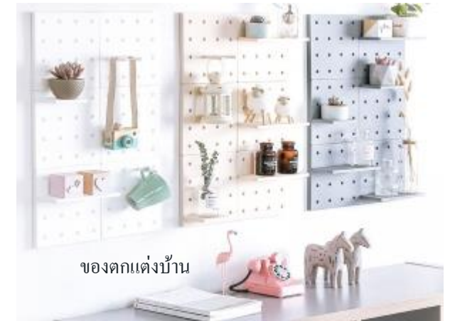
ของตกแต่งบ้าน