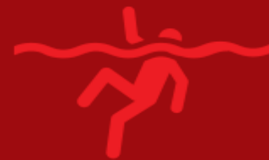
เหตุคนจมน้ำ