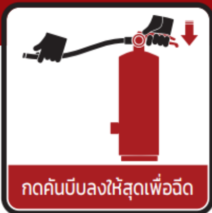
กดคันบีบลงให้สุดเพื่อฉีด