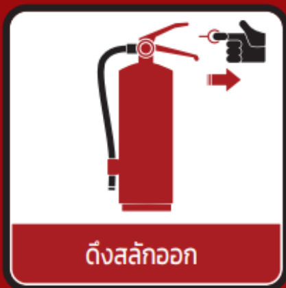
ดึงสลักออก