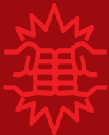
เหตุทะเลาะวิวาท

ผู้จัดทำหวังเป็นอย่างยิ่งว่าคู่มือฉบับนี้จะช่วยให้บุคลากรทุกท่านสามารถนำไปเป็นแนวทางในการดำเนินการในกรณีเกิดเหตุฉุกเฉิน เพื่อลดการประสพอันตรายและสูญเสียดังกล่าวได้ไม่มากนัก