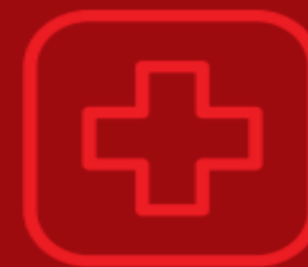
เหตุผู้เจ็บป่วย หรือผู้บาดเจ็บ