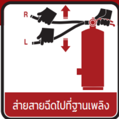
ส่ายสายฉีดไปที่ฐานเพลิง