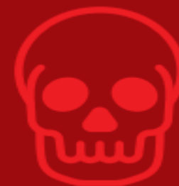
เหตุผู้เสียชีวิต