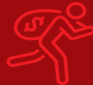
เหตุโจรกรรม