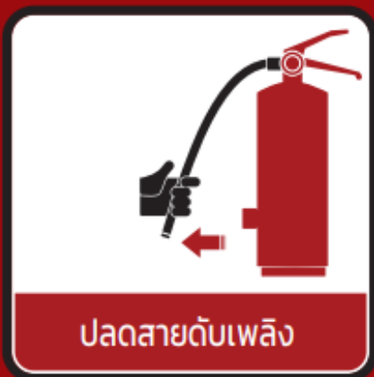
ปลดสายดับเพลิง