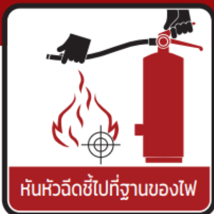
หันหัวฉีดไปที่ฐานของไฟ