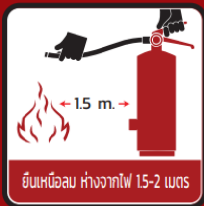
ยืนเหนือลม ห่างจากไฟ 1.5-2 เมตร