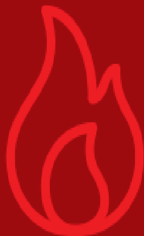
เหตุเพลิงไหม้