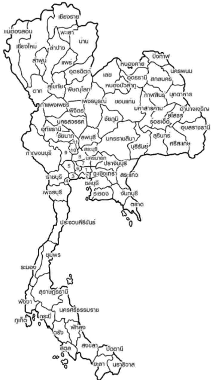
ภาพ 4 แสดงแผนที่ประเทศไทย