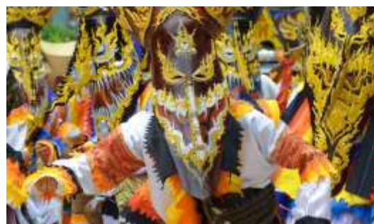
ภาพ 3 แสดงแหล่งท่องเที่ยวที่มนุษย์สร้างขึ้น (ประเภทวัฒนธรรม)