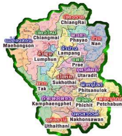
ภาพ 5 แสดงแผนที่ภาคเหนือ

กับสหภาพเมียนมาร์เช่นกัน โดยตั้งอยู่ในแนวตะวันตกเฉียงเหนือ มายังตะวันออกเฉียงใต้ ไหลลงมาตั้งแต่จังหวัดแม่ฮ่องสอน ตาก อุทัยธานี จนถึงจังหวัดกาญจนบุรี นับเป็นเทือกเขาที่ยาวที่สุดของไทย มีความยาวถึง 880 กิโลเมตร (4) เทือกเขาผีปันน้ำ ตั้งอยู่ตามแนวเหนือ-ใต้ ตั้งแต่ตอนใต้ของจังหวัดเชียงราย ไหลลงมาทางตะวันตกของจังหวัดพะเยา ผ่านจังหวัดแพร่ และสิ้นสุดที่จังหวัดลำปาง มีความยาวประมาณ 412 กิโลเมตร (5) เทือกเขาขุนตาล เป็นส่วนหนึ่งของเทือกเขาผีปันน้ำ ตั้งอยู่ตามแนวเหนือ-ใต้ ตั้งแต่จังหวัดเชียงราย เชียงใหม่ ลงมาจนถึงจังหวัดลำปาง เป็นเทือกเขาที่มีอุโมงค์รถไฟความยาว 1,326.05 เมตรลอดผ่าน (6) เทือกเขาหลวงพระบาง เป็นแนวพรมแดนกั้นระหว่างประเทศไทยกับสาธารณรัฐประชาธิปไตยประชาชนลาว ตั้งอยู่ในแนวเหนือ-ใต้ ตั้งแต่ตอนเหนือของจังหวัดน่าน และจังหวัดพะเยาเลื่อนลงมาจนถึงจังหวัดพิษณุโลก มีความยาวทั้งสิ้นประมาณ 590 กิโลเมตร และ(7) เทือกเขาเพชรบูรณ์ เป็นเทือกเขาที่อยู่ต่อเนื่องจากเทือกเขาหลวงพระบางครอบคลุมตั้งแต่ภาคเหนือตอนล่างลงมาถึงภาคกลางตอนบน มีความยาวรวม 586 กิโลเมตร สามารถแบ่งออกได้เป็น 2 ส่วน คือ ส่วนแรกตั้งแต่ทางตะวันออกของแม่น้ำป่าสักผ่านจังหวัดเลย เพชรบูรณ์ ขอนแก่น และชัยภูมิ มีความยาว 236 กิโลเมตรและส่วนที่สองเริ่มจากฝั่งตะวันตกของแม่น้ำป่าสักผ่านจังหวัดเลย พิษณุโลก เพชรบูรณ์ นครสวรรค์ และลพบุรี มีความยาว 350 กิโลเมตร