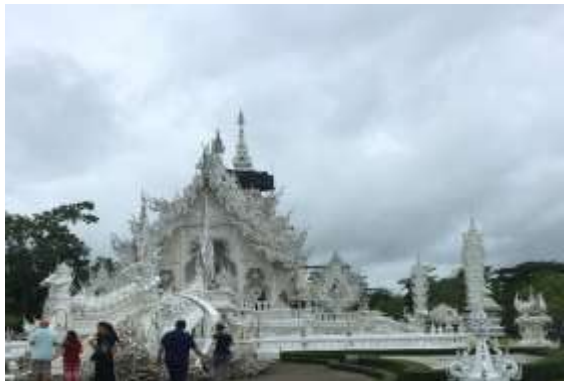
ภาพ 2 แสดงแหล่งท่องเที่ยวที่มนุษย์สร้างขึ้น (ประเภทประวัติศาสตร์)