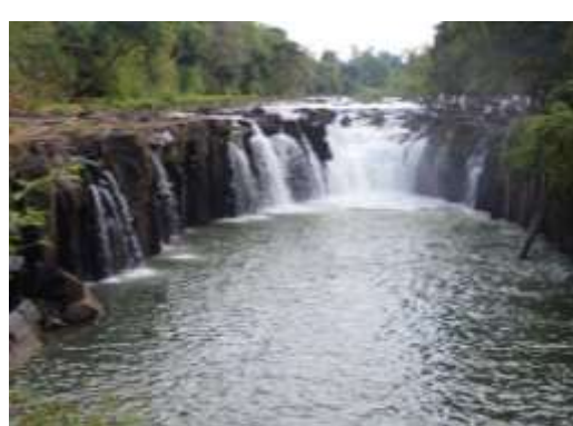
ภาพ 1 แสดงแหล่งท่องเที่ยวที่ธรรมชาติสร้างขึ้น