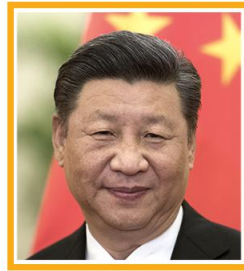
ผู้นำสูงสุด สี จิ้นผิง