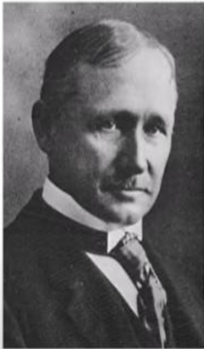
Frederick Winslow Taylor

รูปภาพจาก: en.wikipedia.org/wiki/Frederick_Winslow_Taylor