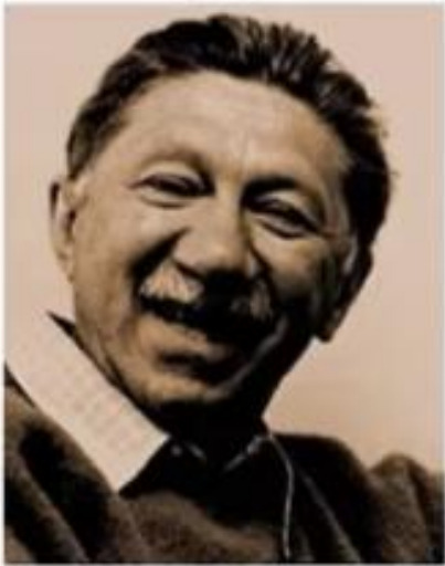
Maslow's hierarchy of needs

2. การขับเคลื่อนด้านมนุษยสัมพันธ์ (Human Relations Movement)