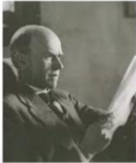
George Elton Mayo