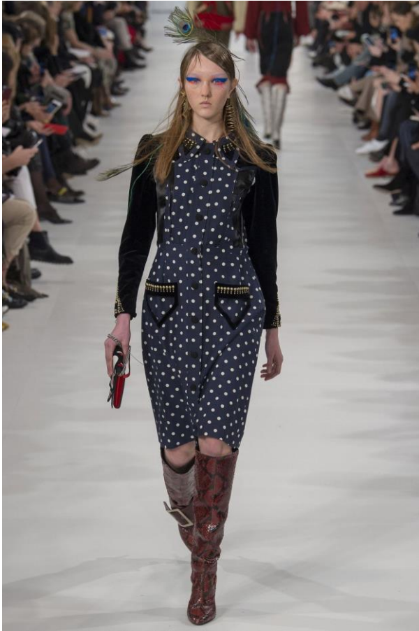
Maison Martin Margiela