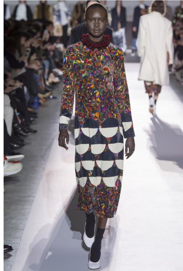
Dries Van Noten