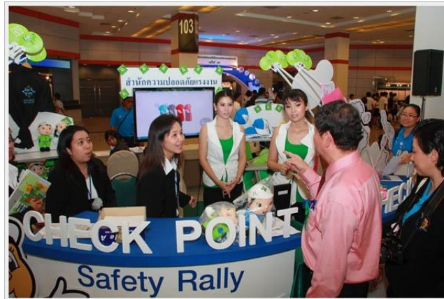
ภาพที่ 3.13 แสดงการจัดแรลลี่ความปลอดภัย