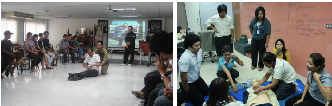
ภาพที่ 3.2 แสดงการบรรยายพิเศษ

2.2 เรื่องเฉพาะเจาะจง เช่น ความปลอดภัยในการใช้เครื่องจักร การใช้อุปกรณ์คุ้มครองความปลอดภัยส่วนบุคคล เป็นต้น หัวข้อต่าง ๆ เหล่านี้จะเสนอรายละเอียดเฉพาะเรื่องใดเรื่องหนึ่ง ซึ่งควรเป็นเรื่องที่เป็นปัญหาเกิดขึ้นกับ พนักงานจะได้สอดคล้องกับความต้องการ