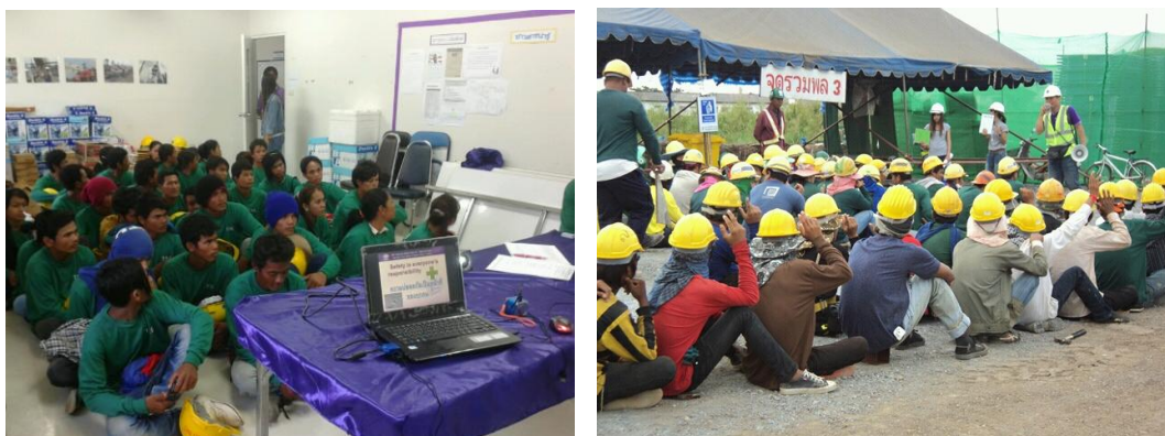
ภาพที่ 3.3 แสดงการสนทนาความปลอดภัย

ความปลอดภัยตอนท้ายของรายการ ควรเปิดโอกาสให้พนักงานได้ซักถามปัญหาเกี่ยวกับวิทยากร เพื่อหาคำตอบที่สงสัย แสดงดังภาพที่ 3.3