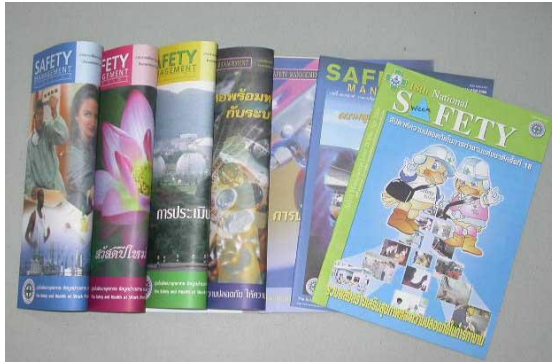
ภาพที่ 3.9 แสดงการเผยแพร่บทความในวารสาร