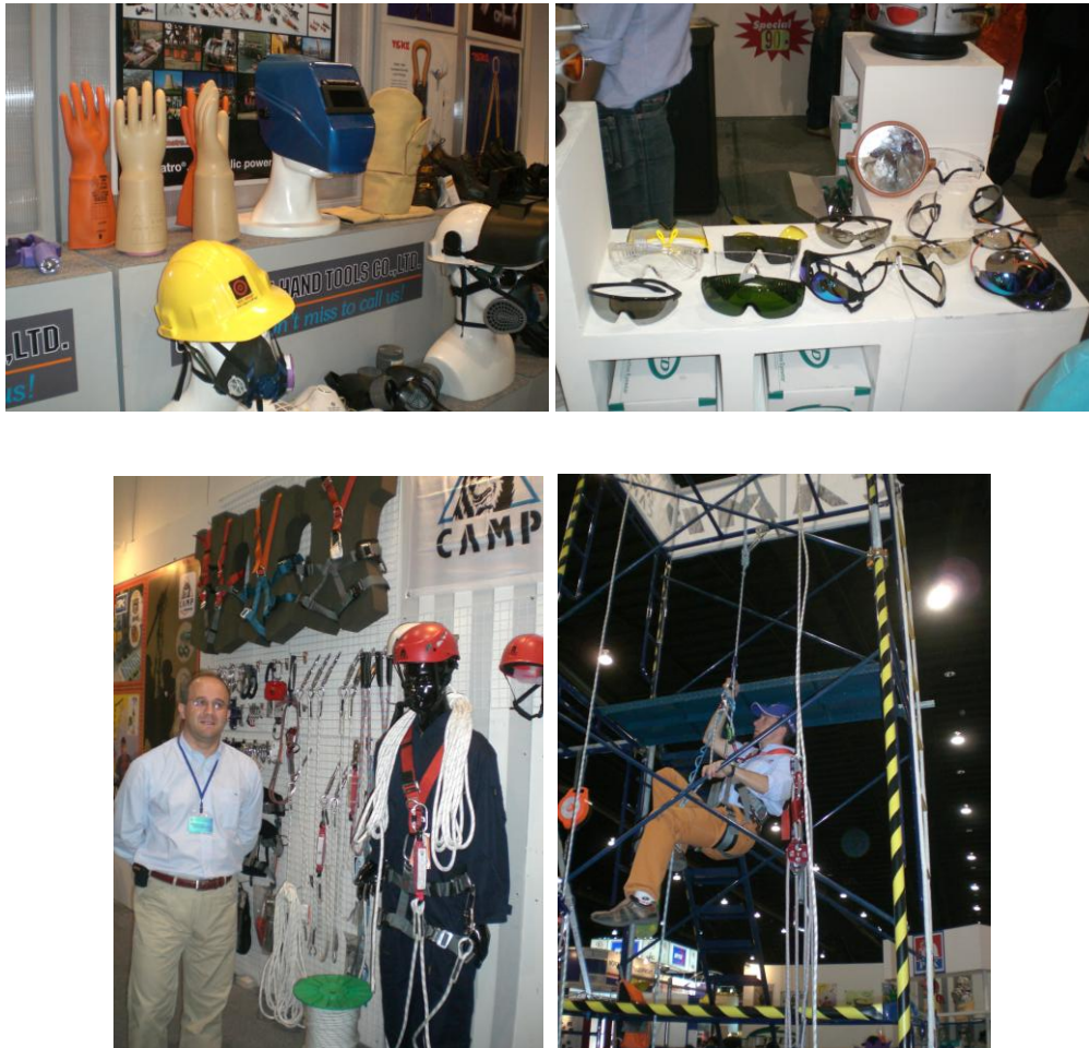
ภาพที่ 3.6 แสดงการจัดนิทรรศการรณรงค์การใช้อุปกรณ์คุ้มครองส่วนบุคคล

ได้ใช้อุปกรณ์อย่างเคร่งครัดในช่วงการรณรงค์ เพื่อให้พนักงานเกิดความเคยชิน จะไม่รู้สึกอึดอัด รำคาญ และจะได้ใช้ตลอดไป แสดงดังภาพที่ 3.6