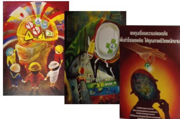
ภาพที่ 3.4 แสดงกิจกรรมการประกวดภาพ โปสเตอร์

ภาพที่ 3.4 ผลการประกวด สถานประกอบการ สามารถนำมาเผยแพร่เป็นการภายใน และใช้ประโยชน์ในการรณรงค์ให้พนักงานมีความระมัดระวังในขณะปฏิบัติงาน นอกจากนี้แล้วยังอาจนำไปร่วมการประกวดภาพโปสเตอร์ความปลอดภัยระดับชาติอีกด้วยสำหรับกติกการส่งภาพเข้าประกวด