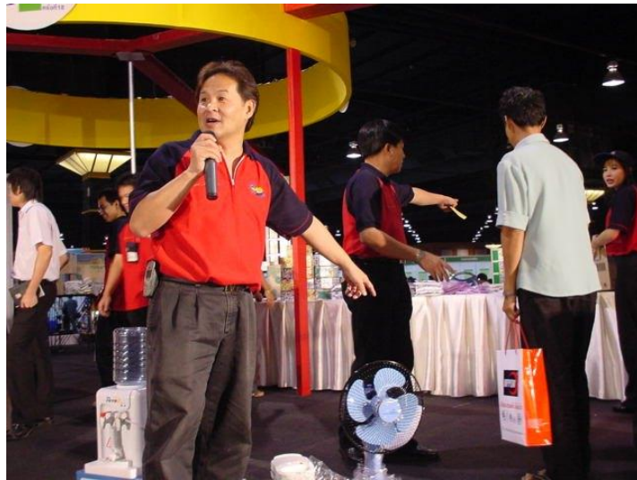
ภาพที่ 3.11 แสดงกิจกรรมการตอบปัญหาชิงรางวัล

14.2 ให้พนักงานแสดงความสามารถเป็นรายบุคคลหรือเป็นกลุ่มบุคคลในการตอบคำถามโดยอาจจัดในลักษณะรายการเกมโชว์ใน รายการโทรทัศน์ ซึ่งสามารถทำในช่วงพักเที่ยง หลังจากพนักงานรับประทานอาหารแล้ว และสามารถเข้ามานั่งชมช่วยกันเชียร์เพื่อน ๆ ที่ขึ้นไปบนเวทีตอบคำถาม หากได้พิธีกรที่มีความสามารถ รายการเช่นนี้จะดำเนินการ ได้อย่างสนุกสนาน พนักงานได้รับความเพลิดเพลิน คลายความเครียดจากการทำงาน และยังได้รับความรู้จากการถามตอบปัญหาความปลอดภัยอีกด้วย