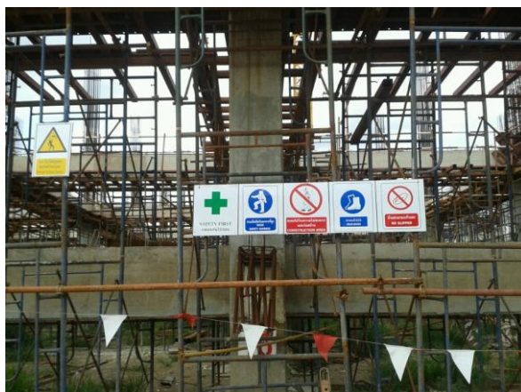
ภาพที่ 3.7 แสดงการใช้สัญลักษณ์ความปลอดภัย