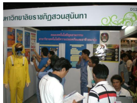
ภาพที่ 3.1 แสดงการจัดนิทรรศการ