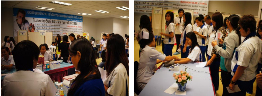
ภาพที่ 3.5 แสดงกิจกรรมส่งเสริมการตรวจสุขภาพอนามัย