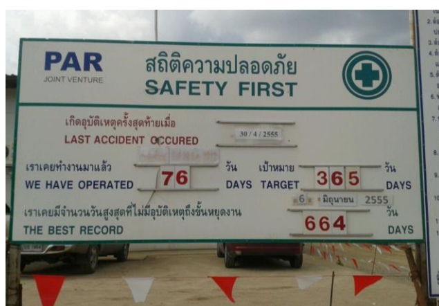
ภาพที่ 3.12 แสดงการจัดทำป้ายแสดงสถิติอุบัติเหตุภายในสถานประกอบการ

ติดตั้งไว้หน้าสถานประกอบการทุกหลังหรือเฉพาะบริเวณที่ติดประกาศรวมของสถานประกอบการหรือบริเวณที่ พนักงานชุมนุมกันมาก เช่น บริเวณโรงอาหาร เป็นต้น ป้ายประกาศนี้จะติดข้อความ บทความ รูปภาพ ตลอดจนเรื่องราวต่างๆ ที่เกี่ยวข้องกับ ความปลอดภัยในการทำงาน หากเป็น บทความควรถ่ายขยายให้ตัวอักษรมีขนาดใหญ่พอสมควร เพื่อสะดวกแก่การอ่าน บทความไม่ควร ยาวมากนัก อาจจะตัดเรื่องราวข่าวสารการเกิดอุบัติเหตุในการทำงานที่ลงพิมพ์ในหนังสือพิมพ์ เพื่อ เป็นกรณีศึกษา เตือนสติพนักงานทุกคนให้ตระหนัก ถึงอันตรายอาจที่เกิดขึ้นจากการทำงาน ป้าย ประกาศนี้ผู้รับผิดชอบควรปรับเปลี่ยนบทความข้อมูลต่างๆ เพื่อจะเป็นที่น่าสนใจแก่พนักงาน