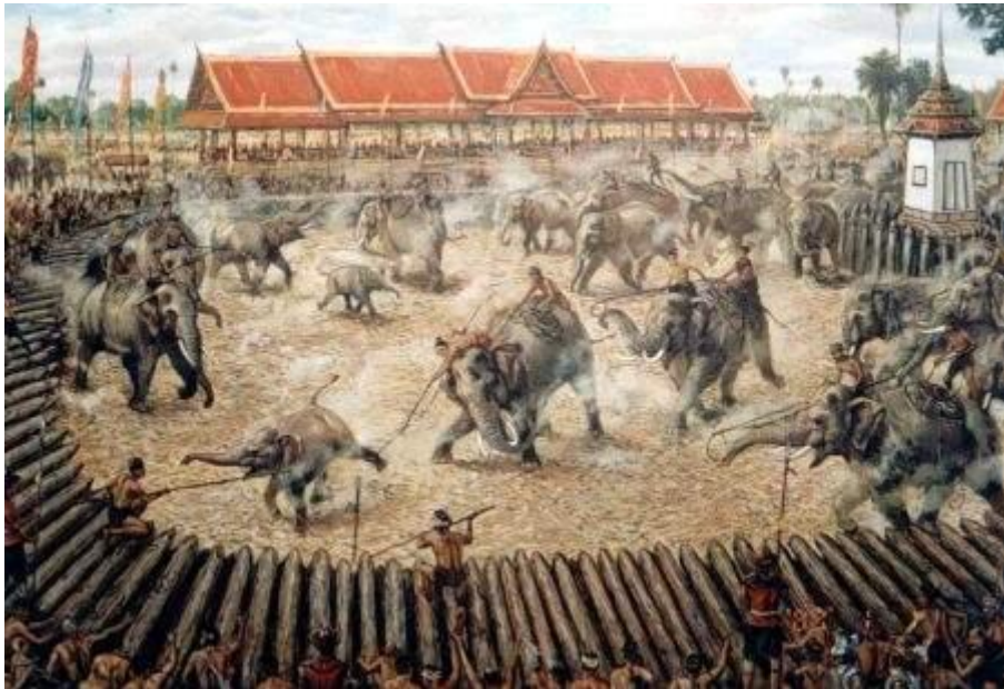
ภาพจากภาพยนตร์เรื่องสุริโยไท