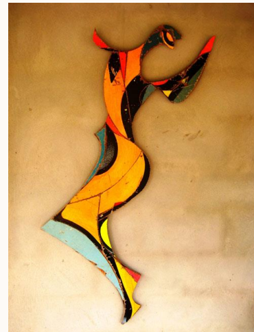
(ผลงานของ นฤมล ปัดสำราญ)

รูปแบบกึ่งนามธรรม (Semi Abstract) เป็นการถ่ายทอดที่ผิดเบนไปจากรูปธรรมหรือ แบบเหมือนจริงด้วยการตัดทอนรูปทรงจากของจริงให้เรียบง่าย แต่ยังมีเค้าโครงเดิมอยู่สามารถดูรู้ว่าเป็นภาพอะไร