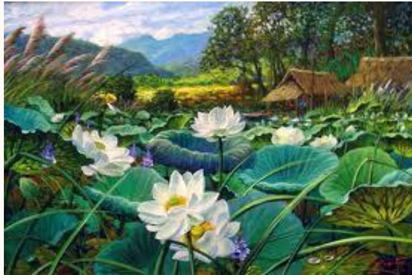
( ผลงานของ สจ๊วต ปุยอ็อก )

รูปแบบรูปธรรม (Realistic) ศิลปะแบบเหมือนจริง เป็นศิลปะที่ไม่ซับซ้อนมีเนื้อหาสาระที่ปรากฏเด่นชัดแต่ผู้สร้างและผู้ชมต้องมีความรู้เรื่องนั้นด้วย เช่น ภาพคน ภาพสัตว์