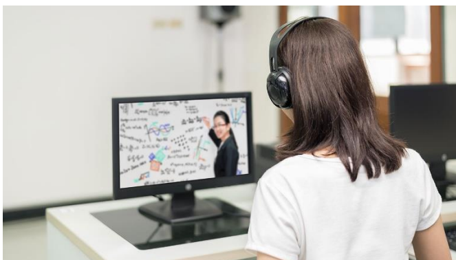
ภาพที่ 10.17 การจัดการรายการเพื่อการศึกษาแบบบรรยายคนเดียว

การเขียนบทรายการวิทยุโทรทัศน์เพื่อการศึกษาในรูปแบบบรรยายคนเดียวมักจะเขียนระบุให้การลำดับรายละเอียดรายการตั้งแต่ต้นจนจบรายการดำเนินไปด้วยตัวผู้ดำเนินรายการหรือวิทยากรคนเดียว ซึ่งทำหน้าที่บรรยายสาระความรู้ต่าง ๆ ตามที่ได้กำหนดหัวข้อไว้ โดยในการเขียนบทจะต้องพิจารณาให้ครอบคลุมถึง วัตถุประสงค์ กลุ่มเป้าหมาย เนื้อหาหรือสาระของเรื่อง ลำดับความสำคัญและความต่อเนื่องของสาระความรู้ที่น่าเสนอ ลักษณะการใช้ภาษา การใช้ภาพประกอบ ทั้งภาพนิ่งและภาพเคลื่อนไหว