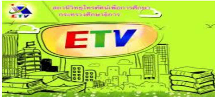
ภาพที่ 10.16 รายการโทรทัศน์เพื่อการศึกษา