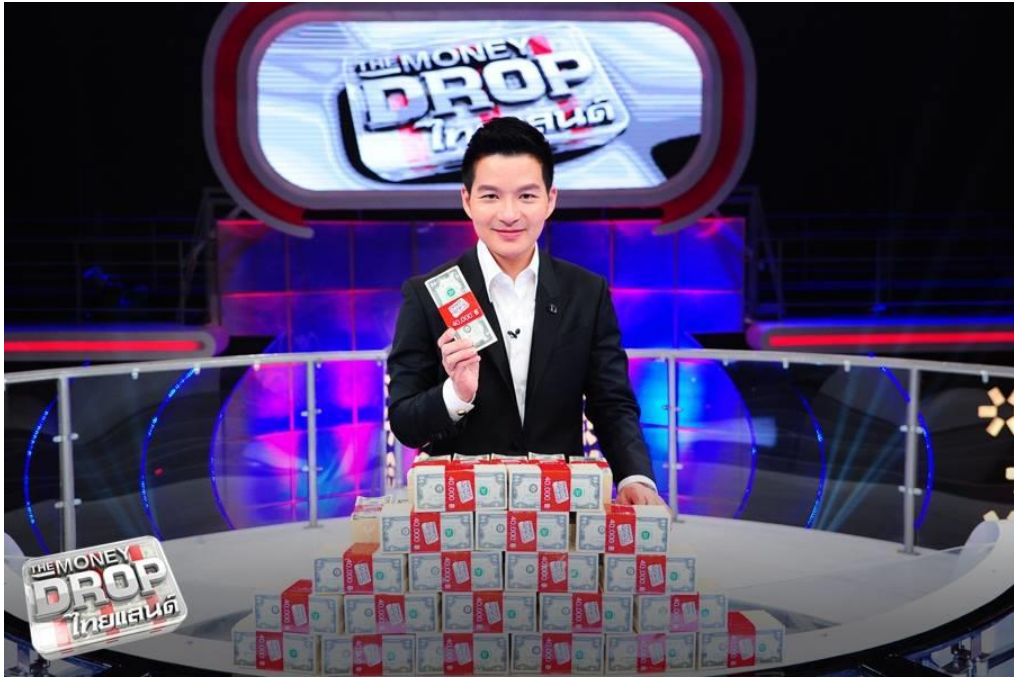
ภาพที่ 10.15 ตัวอย่างรายการเกมส์โชว์