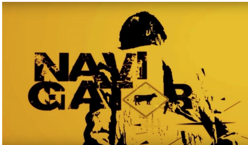
ภาพที่ 10.8 ตัวอย่างชื่อสารคดี

ที่มา https://thestandard.co/jesdaporn-pholdee-navigator-end/ , เผยแพร่เมื่อวันที่