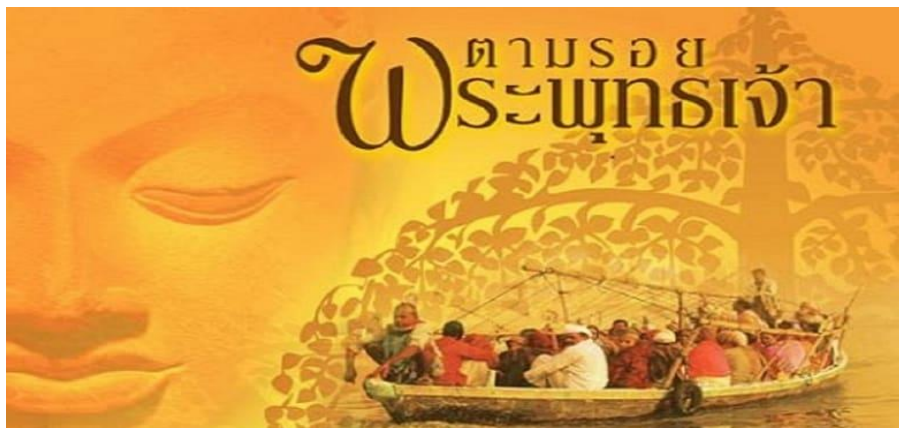
ภาพที่ 10.3 สารคดีเกี่ยวกับพระพุทธเจ้า

สารคดีประเภทนี้มักจะนำเสนอเป็นรายการเนื่องในวันพิเศษมักเป็นเรื่องราวเกี่ยวกับเทศกาลสำคัญต่าง ๆ ของชาติ เช่น วันสำคัญทางพระพุทธศาสนาก็มักจะมีสารคดีเกี่ยวกับพระพุทธเจ้า หรือพุทธประวัติที่เกี่ยวข้องกับวันสำคัญนั้น วันพ่อแห่งชาติ ก็มักจะมีสารคดีเฉลิมพระเกียรติเกี่ยวกับพระราชกรณียกิจของพระบาทสมเด็จพระเจ้าอยู่หัวที่มีคุณูปการต่อประชาชนในแผ่นดิน