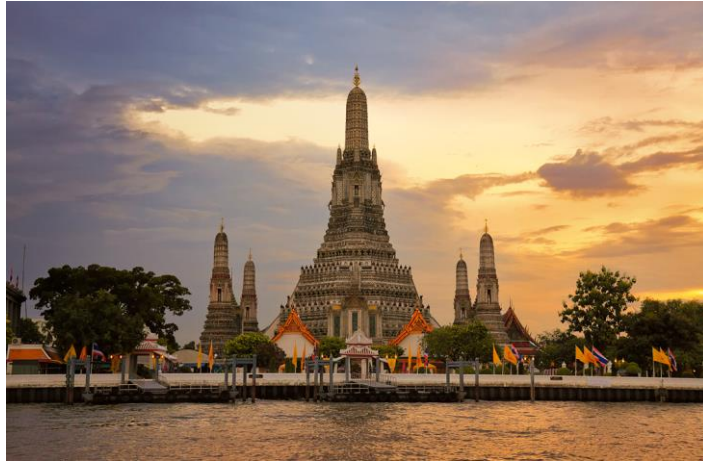
ภาพที่ 10.4 พระปรางค์วัดอรุณราชวรมหาวิหาร

เป็นเรื่องราวเกี่ยวกับสถานที่ที่น่าสนใจมีความพิเศษสวยงาม มีคุณค่าในเชิงสถาปัตยกรรม วัฒนธรรมประเพณี เช่น วัดวาอาราม ประเพณีสำคัญ มีคุณค่าในเชิง 3.0 ทรัพยากรธรรมชาติที่งดงาม เช่น ป่าไม้ ภูเขา น้ำตก มีคุณค่าเชิงประวัติศาสตร์ เช่น เมืองเก่าอยุธยา เมืองเก่าสุโขทัย เป็นต้น