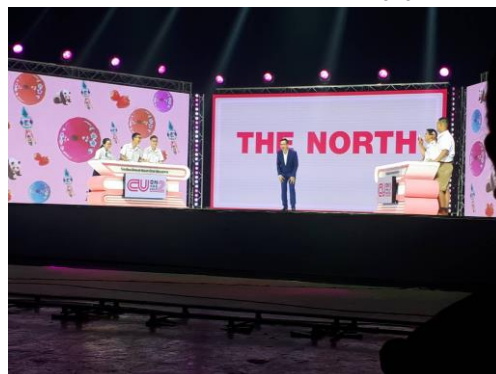
ภาพที่ 10.14 ภาพรายการแข่งขันตอบปัญหา

รายการเกมส์โชว์ประเภทแข่งขันตอบปัญหา เป็นรายการที่เปิดโอกาสให้ผู้เข้าร่วมรายการได้แสดงความสามารถทางด้านสติปัญญา ความรอบรู้ โดยที่ฝ่ายผลิตรายการได้สร้างโจทย์หรือได้กำหนดปัญหาให้ผู้เข้าร่วมแข่งขันได้ตอบหรือได้ใช้สติปัญญาในการแก้ไข