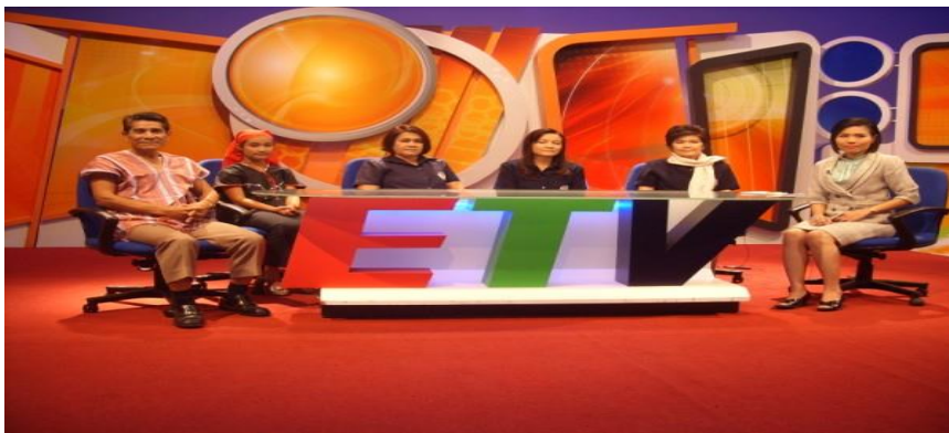
ภาพที่ 10.18 รายการโทรทัศน์เพื่อการศึกษาในรูปแบบการสนทนา ของ กศน.อำเภอแก่งกระจาน

การเขียนบทรายการวิทยุโทรทัศน์ในรูปแบบการสนทนาเป็นการเขียนให้มีคนพูดร่วมกันตั้งแต่สองคนขึ้นไป ผู้ทำหน้าที่ดำเนินรายการมักจะเป็นผู้ที่มีความรู้ความเชี่ยวชาญในประเด็นที่นำมาสนทนา โดยผู้สนทนา ทั้งผู้ดำเนินรายการ ผู้ร่วมสนทนาต่างก็มีบทบาทในการแสดงความคิดเห็นหรือโต้แย้งแสดงความคิดเห็นต่างได้ โดยมีแนวทางการเขียนให้ครอบคลุมถึงเนื้อหาสาระ ผู้ดำเนินรายการ ผู้ร่วมสนทนา เวลา ลำดับการนำเสนอเนื้อหาสาระ การใช้ภาษา สัดส่วนของบท การใช้ตัวอักษร ภาพประกอบต่างๆทั้งภาพนิ่งและภาพเคลื่อนไหว