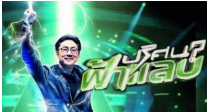
ภาพที่ 10.13 ภาพรายการโทรทัศน์ประเภทเกมส์โชว์

รายการเกมส์โชว์ เป็นรายการที่มักจะมีกิจกรรมที่ให้ผู้ร่วมรายการใช้ทักษะความสามารถทางด้านร่างกายกับสติปัญญา หรือการเสี่ยงทาย การเสี่ยงโชค ผู้ผลิตรายการมักจะหาความแปลกใหม่ มีความหลากหลายของกิจกรรม มีการแสวงหาผู้ร่วมรายการจากหลากหลายสาขาอาชีพ เพื่อให้เกิดความตื่นเต้นเร้าใจ