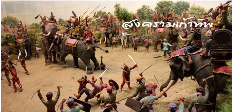
ภาพที่ 10.2 ประวัติศาสตร์ไทยรบพม่า