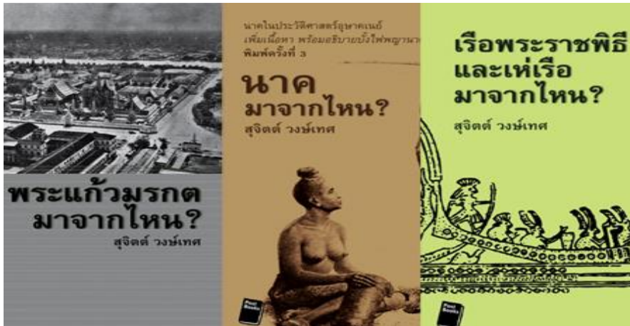
ภาพที่ 10.12 ข้อมูลทุติยภูมิ