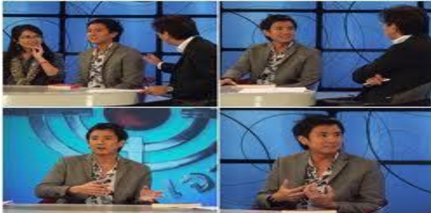
ภาพที่ 10.19 รายการโทรทัศน์รูปแบบการสัมภาษณ์