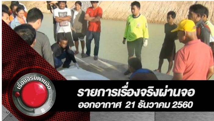
ภาพที่ 10.7 สารคดีเชิงข่าว

เป็นการนำเสนอข่าวในแบบสารคดี ถ่ายทอดเรื่องที่เขียนขึ้นจากเค้าความจริงที่เคยปรากฏเป็นข่าวในสื่อต่าง ๆ มาแล้ว โดยหยิบยกส่วนใดส่วนหนึ่งของข่าวหรือเรื่องราวมาเขียนก็ได้ ไม่จำเป็นต้องเล่ารายละเอียดให้ครบทุกประเด็นเหมือนข่าว