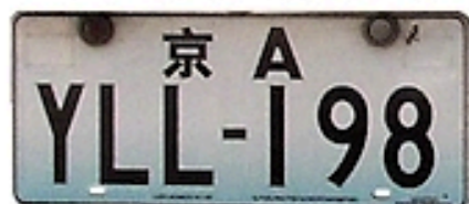
2002, Beijing (for a limited time) (5)