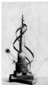
Abb. 12. Bauhaus Weimarer, Ausstellung "Form folgt Funktion". Weimarer Bauhaus, Ausstellung über die Gestaltung und Herstellung der Bauhausarbeiten.

Q111 Form Follows Function เป็นงานที่ถือ Arts and Crafts แต่ได้เอื้อมไปของอุตสาหกรรมยุคใหม่ และได้พัฒนาการคิดที่เรียกว่า De Stijl or Constructivism ที่มุ่งบูรณาการศิลปะกับ เทคโนโลยีและวิทยาศาสตร์ในปี 1923 "ศิลปะและเทคโนโลยี - ความปรองดอง" (Art and Technology - A New Unity)