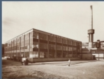
Industry building bauhaus