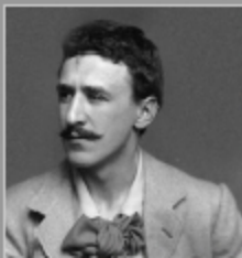
Charles Rennie Mackintosh - UK, 1868-1928