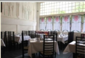
The Willow Tea Rooms, 1902-1904