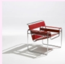
Wassily Chair (1925) by Marcel Breuer