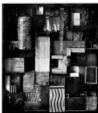
Abb. 11. Bauhaus Weimarer, Ausstellung "Form folgt Funktion". Weimarer Bauhaus, Ausstellung über die Gestaltung und Herstellung der Bauhausarbeiten.