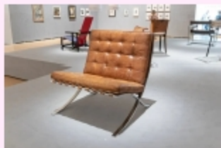
Barcelona Chair (1929) by Ludwig Mies van der Rohe "Less is more"