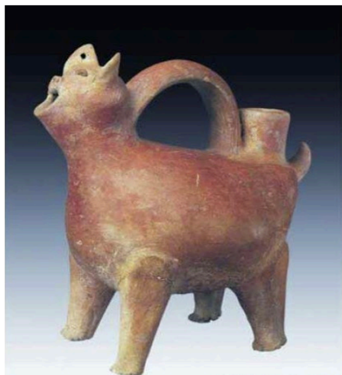
■泰安大汶口文化遗址出土红陶兽形壶