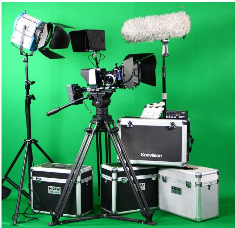
ภาพที่ 3.7 อุปกรณ์สำหรับการถ่ายทำ

การเตรียมอุปกรณ์ถ่ายทำ เป็นขั้นตอนที่ฝ่ายผลิตรายการโดยเฉพาะผู้รับผิดชอบโครงการถ่ายทำ จะต้องเตรียมอุปกรณ์ให้พร้อม เช่น กล้องโทรทัศน์ ขาตั้งกล้อง รางเลื่อน เป็นต้น ซึ่งอุปกรณ์ที่เกี่ยวข้องนี้มีหลายรายการ ดังนั้นเมื่อจะเข้าสู่กระบวนการถ่ายทำจะต้องจัดเตรียมอุปกรณ์ให้พร้อมและเพียงพอในการทำงาน