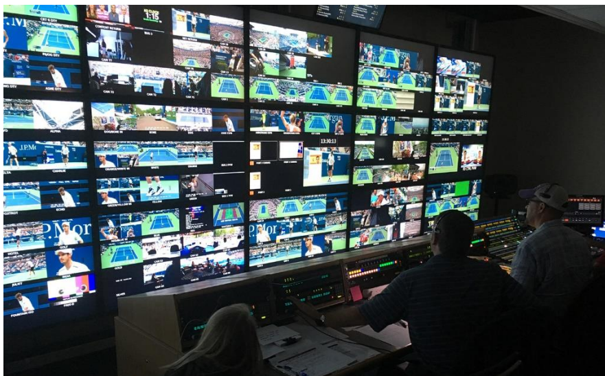
ภาพที่ 3.12 การทำงานของผู้กำกับรายการ

ผู้กำกับรายการถือว่าเป็นผู้มีบทบาทสูงที่สุดในขณะกำลังดำเนินการผลิตรายการ เป็นผู้สร้างสรรค์และกำกับให้การผลิตเป็นไปตามบทวิทยุโทรทัศน์ที่ได้เขียนไว้ก่อนหน้านี้ หรือกำกับให้การผลิตตรงตามวัตถุประสงค์ของรายการ ผู้กำกับต้องเข้าประชุมเพื่อเตรียมการก่อนการผลิตทุกครั้ง เพื่อให้ทราบแนวความคิด นอกจากนี้ยังมีบทบาทในการประสานงานกับหลายฝ่าย เช่น ฝ่ายผลิตรายการ ผู้เขียนบท ผู้กำกับเวที ผู้กำกับแสง ฝ่ายออกแบบฉาก ฝ่ายเสียง ทั้งจะต้องมีการนัดซักซ้อม เพื่อให้ผสมผสานองค์ประกอบการผลิตทั้งหมดให้ลงตัว หลังจากถ่ายทำแล้วผู้กำกับรายการยังต้องดูแลให้คำปรึกษาเกี่ยวกับการลำดับภาพ การผสมเสียง เป็นต้น เพื่อให้ผลงานออกมาสมบูรณ์ที่สุด