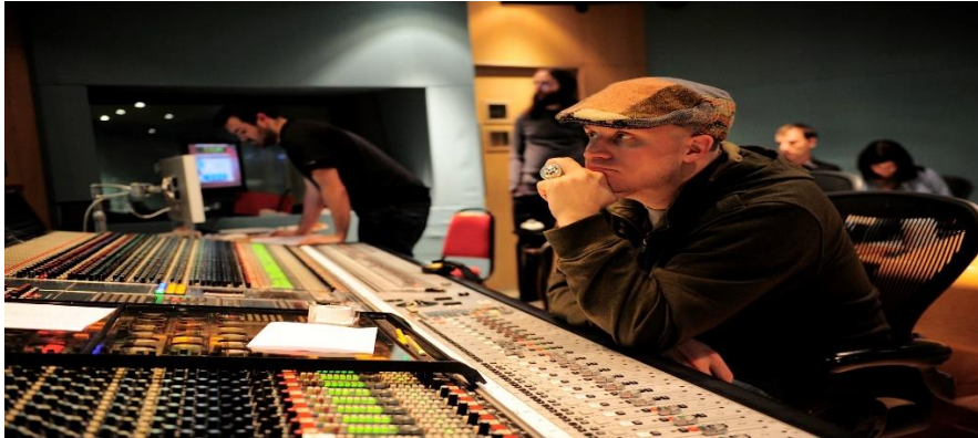
ภาพที่ 3.16 ผู้กำกับเสียง

ผู้กำกับเสียงหรือช่างเสียง มีหน้าที่ควบคุมเกี่ยวกับเรื่องเสียงทั้งหมดในรายการทำงานกับแผงควบคุมเสียงหรือเครื่องผสมสัญญาณเสียง (Audio Mixer) และเครื่องให้กำเนิดสัญญาณเสียงในลักษณะต่าง ๆ เช่น เครื่องเล่นแผ่นเสียง เครื่องบันทึกเสียง และไมโครโฟน เป็นต้น