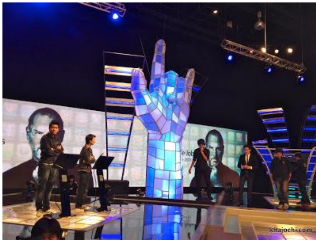
ภาพที่ 3.8 การซักซ้อมก่อนการถ่ายทำรายการจริง

การซักซ้อมถือเป็นขั้นตอนที่ช่วยให้รู้ปัญหาที่จะเกิดขึ้นจริงในระหว่างการผลิตรายการจริง ซึ่งทำให้แก้ไขและป้องกันได้ล่วงหน้า ในการซักซ้อมก่อนการผลิตจริงนั้น กระทำได้สองขั้นตอน ได้แก่ การซ้อมย่อย ในขั้นนี้จะกระทำนอกสถานที่จริง หรือในสถานที่จริงก็ได้ แล้วแต่สะดวกหรือตามความเหมาะสม จะซ้อมก็รอบก็ได้จนกว่าจะพอใจ เพื่อให้ผู้ที่มีส่วนเกี่ยวข้องคุ้นเคยกับอุปกรณ์ สถานที่ หรือบทบาทหน้าที่ของตน เมื่อเข้าสู่ขั้นตอนการผลิตจริง และอีกขั้นตอนหนึ่งเป็นการซ้อมใหญ่ ในขั้นนี้จะเป็นการซ้อมแสดงทุกอย่างเหมือนจริง ซ้อมในสถานที่จริง มีการถ่ายทำและบันทึกภาพจริง