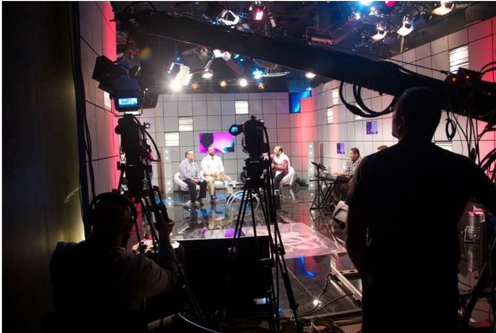
ภาพที่ 3.1 การผลิตรายการในห้องส่ง