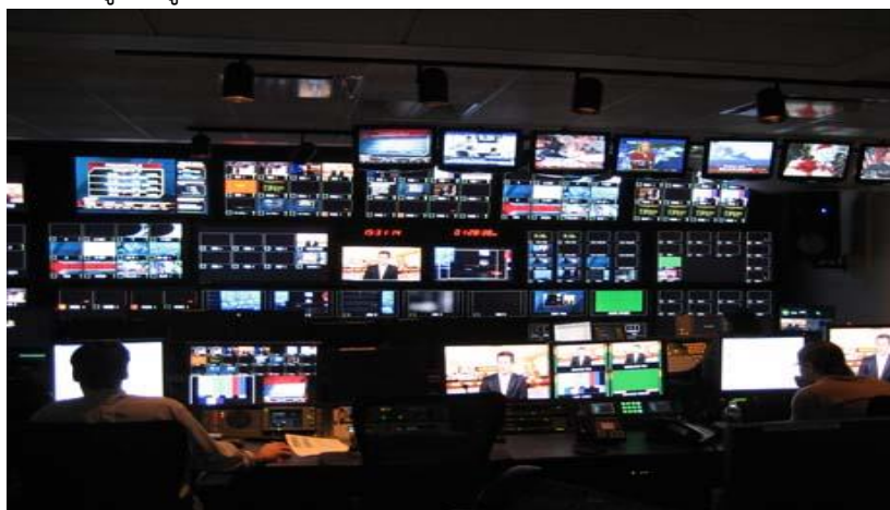
ภาพที่ 3.19 การควบคุมสัญญาณภาพ

ผู้ควบคุมสัญญาณภาพเป็นผู้ที่มีความเข้าใจเทคนิคการเกิดภาพ มีหน้าที่คอย ควบคุมเพื่อให้ได้สัญญาณภาพที่สมบูรณ์ เพราะภาพเป็นหัวใจหลักของรายการ ถ้าภาพออกมา สวยงามก็จะเป็นที่ดึงดูดใจผู้ชมให้ติดตาม