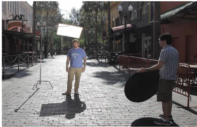
ภาพที่ 3.2 การผลิตรายการนอกสถานที่

การผลิตรายการนอกสถานที่ มีขั้นตอนดำเนินการผลิตหลายขั้นตอนนอกจากดังกล่าวมาแล้วยังมีสิ่งต่าง ๆ ที่ต้องเตรียมการล่วงหน้าหลายประการ ซึ่งผู้เกี่ยวข้องต้องปฏิบัติงานตามสถานการณ์ต่าง ๆ ที่มีการเปลี่ยนแปลงหรือมีปัจจัยแวดล้อมด้วย เพราะอาจมีปัจจัยแวดล้อมนอกเหนือความคาดหมายที่อาจเกิดขึ้นได้