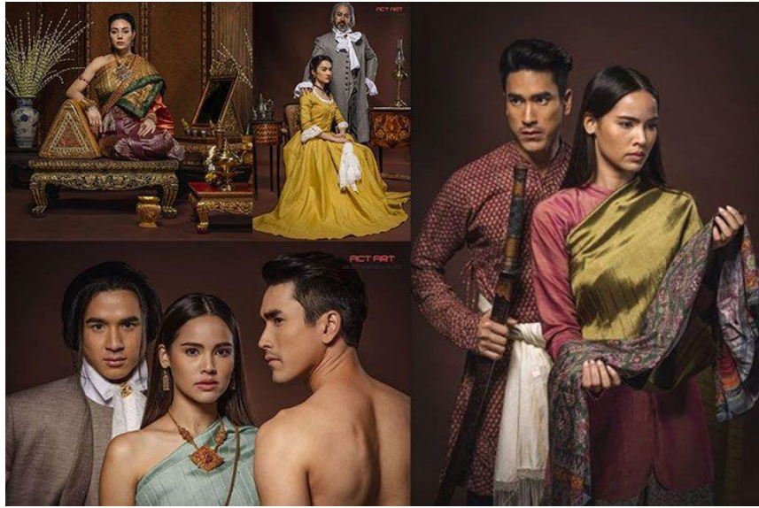
ภาพที่ 3.23 การจัดเครื่องแต่งกายให้เหมาะสมตามบทละคร ที่มา https://www.posttoday.com/ent/news/601204 , เผยแพร่เมื่อวันที่ 19 ก.ย. 62, สืบค้นเมื่อวันที่ 12 มิ.ย. 63