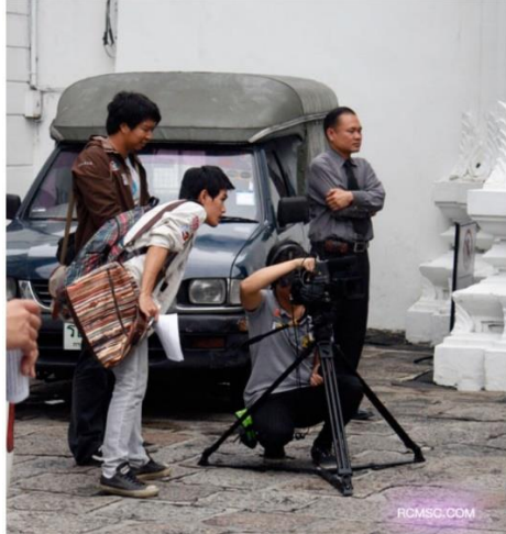
ภาพที่ 3.20 ช่างภาพกำลังถ่ายทำรายการ

ช่างภาพเป็นผู้มีบทบาทสำคัญในการทำหน้าที่ควบคุมกล้องให้สามารถจับภาพตามที่คุณกำกับภาพต้องการ ช่างภาพจะต้องเป็นผู้มีความรู้ในการถ่ายภาพเป็นอย่างดี รวมทั้งมีความเข้าใจเรื่ององค์ประกอบภาพ และมุมภาพ เป็นต้น