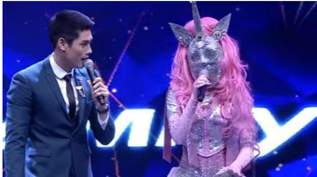
ภาพที่ 3.14 พิธีกรดำเนินรายการ

ที่มา https://pantip.com/topic/36006499 , เผยแพร่เมื่อวันที่ 13 ม.ค. 60, สืบค้นเมื่อวันที่ 12 มิ.ย. 63