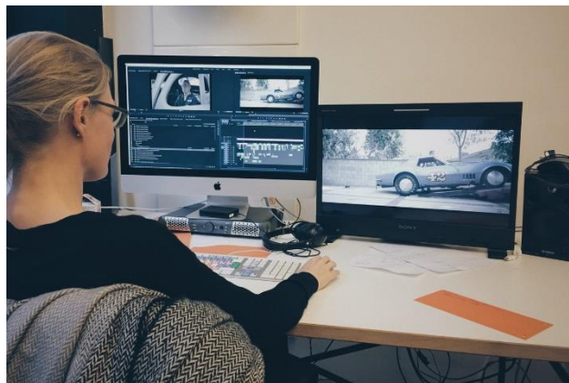
ภาพที่ 3.3 ภาพการตัดต่อภาพและการบันทึกเสียง