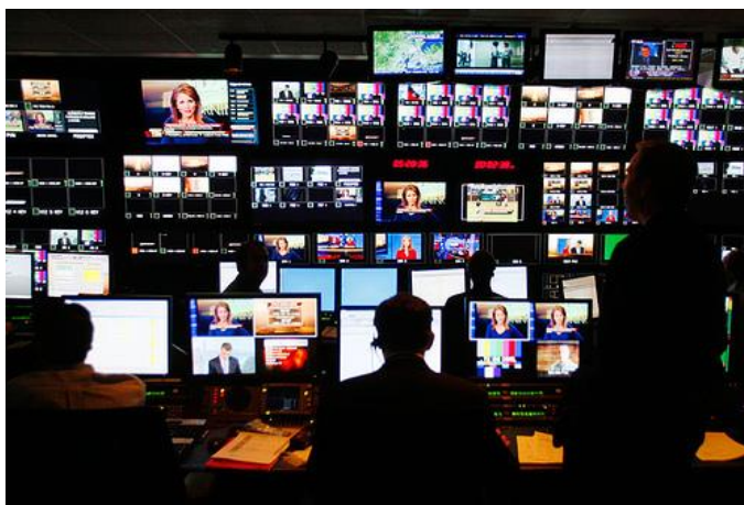
ภาพที่ 3.15 ผู้กำกับเทคนิค

ผู้กำกับเทคนิค จะทำหน้าที่รับผิดชอบควบคุมแผงควบคุมการผลิต (Switcher) โดยเลือกภาพ ตามความต้องการของผู้กำกับการรายการ หรือทำภาพพิเศษ (Special Effect) นอกจากนี้ ยังมีหน้าที่ควบคุมและประสานงานบุคลากรด้านเทคนิค ได้แก่ ผู้กำกับเสียง ผู้กำกับแสง และผู้ควบคุมสัญญาณภาพ