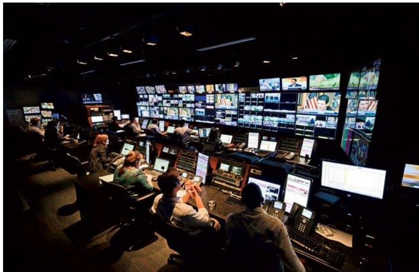
ภาพที่ 3.17 การควบคุมแผงควบคุมสัญญาณภาพและเสียง