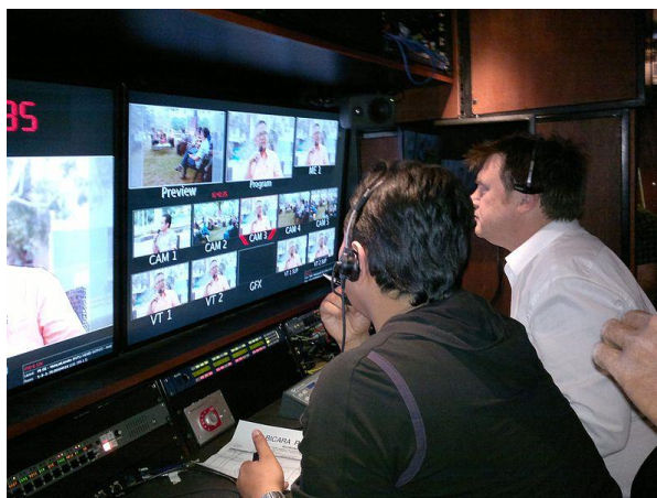
ภาพที่ 3.21 การทำงานของช่างตัดต่อลำดับภาพ

ช่างตัดต่อลำดับภาพจะทำหน้าที่ตัดต่อและจัดลำดับภาพ เพื่อให้เกิดความต่อเนื่องของลำดับเหตุการณ์ ช่างตัดต่อจะต้องมีศิลปะในการเล่าเรื่องด้วยภาพ และสามารถใช้เทคนิคโปรแกรมตัดต่อภาพ และใช้โปรแกรมการสร้างภาพพิเศษได้ เพื่อสร้างสีสันให้แก่รายการ