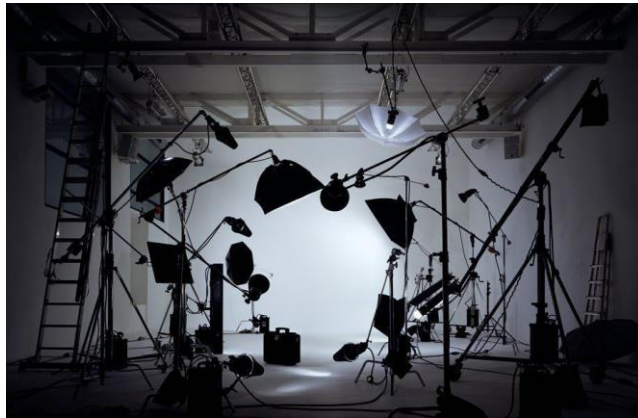
ภาพที่ 3.18 การควบคุมและการจัดแสง

ผู้กำกับแสง มีหน้าที่ออกแบบแสงในการผลิตรายการวิทยุโทรทัศน์ เป็นการ ทำงานประสานกับผู้กำกับรายการ เพื่อจะได้เข้าใจแนวคิดของรายการ เข้าใจตำแหน่งการจัดวางวัสดุ อุปกรณ์ประกอบรายการ และตำแหน่งของผู้แสดงทั้งหมด เพื่อที่จะจัดแสงได้อย่างลงตัว รวมถึง ทำความเข้าใจจังหวะการให้แสงในขณะผลิตรายการด้วย