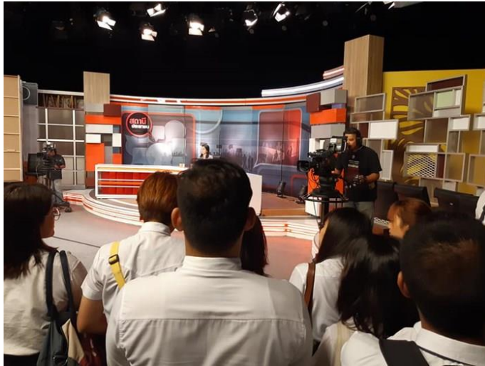
ภาพที่ 3.9 การผลิตรายการสด