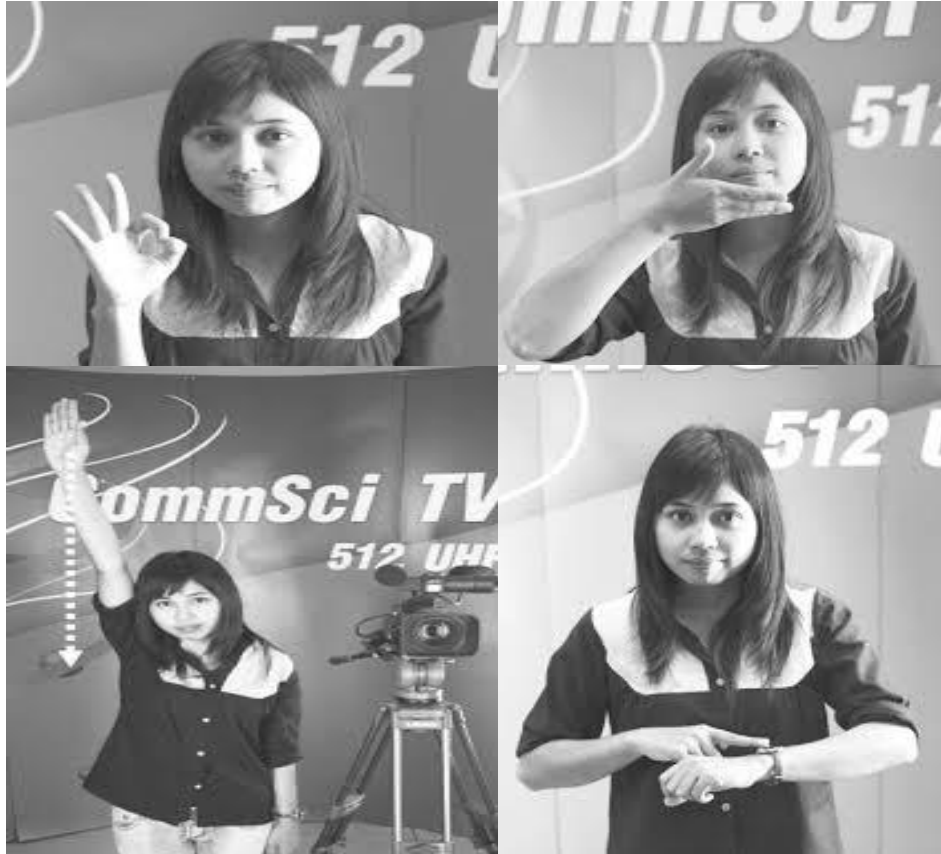
ภาพที่ 3.13 สัญลักษณ์มือในการกำกับรายการหรือกำกับเวที

ผู้กำกับเวทีจะต้องรู้และเข้าใจ สัญลักษณ์ต่าง ๆ ที่ใช้ในการกำกับเวที มีไหวพริบ ปฏิภาณสูง แก้ปัญหาเฉพาะได้ดี สามารถควบคุมสถานการณ์ของเวทีให้เป็นไปตามเจตนาของ ผู้กำกับราย ทั้งนี้ผู้กำกับเวทียังต้องทำหน้าที่ดูแลและเอาใจใส่ผู้มาร่วมรายการไปพร้อมกันด้วย