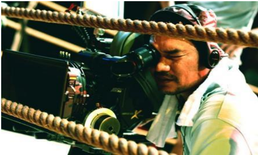
ภาพที่ 3.11 Producer

ในตำแหน่งผู้ผลิตรายการนี้ตำราบางเล่ม หรือการเรียกขานกันในแวดวงวิชาชีพ อาจใช้หมายถึง ผู้อำนวยการสร้าง ผู้กำกับการผลิต ผู้จัด หรือนักจัดรายการ แต่ถึงจะเรียกอย่างไรก็ตามก็มีหน้าที่เหมือนกัน คือดูแลการผลิตให้สำเร็จบรรลุวัตถุประสงค์ตามที่ได้กำหนดไว้ ทำหน้าที่เป็นผู้นำ รับผิดชอบรายการทั้งหมด ถือว่าเป็นผู้มีบทบาทสูงในการกำหนดทิศทางของรายการ นอกจากนี้ยังต้องทำหน้าที่ด้านการบริหารงานโดยการมอบหมายงานด้านต่าง ๆ แก่บุคลากรที่เกี่ยวข้อง เช่น ผู้ดำเนินรายการ ช่างกล้อง ผู้กำกับรายการ ผู้กำกับเวที เป็นต้น