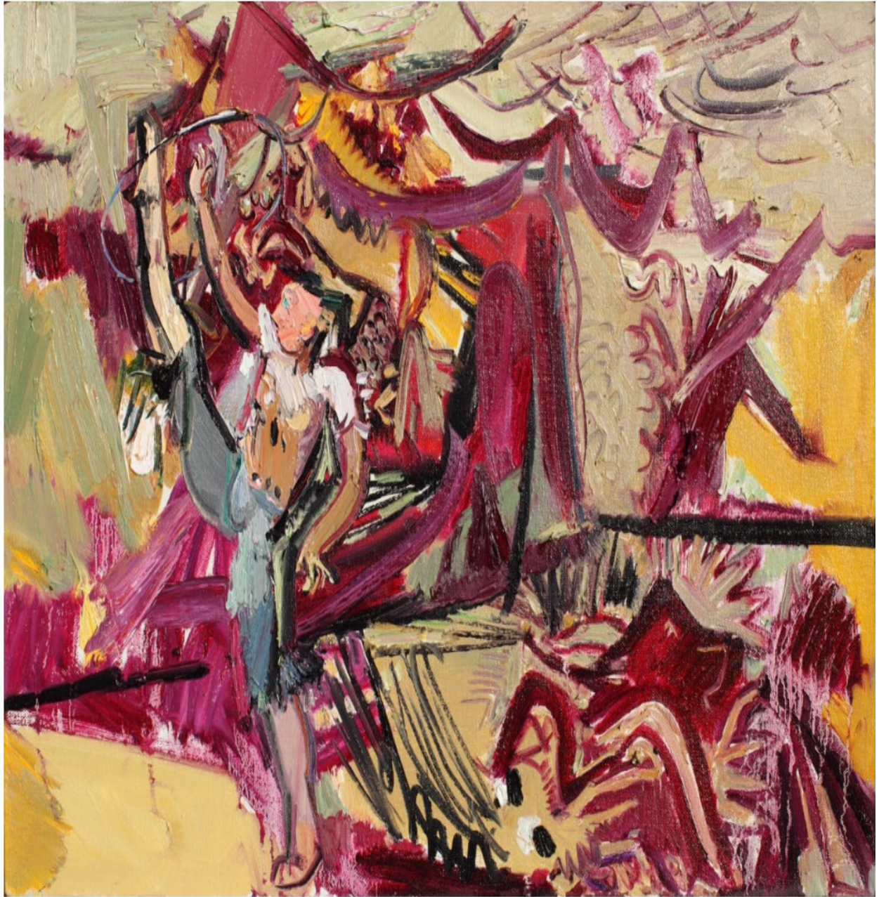
ศิลปิน : เขียนผิง