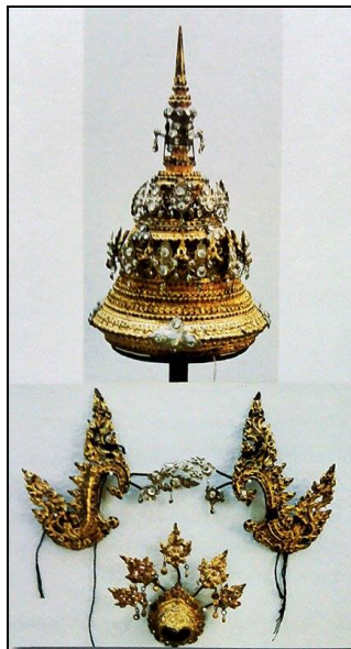
ภาพที่ 2.6 รัตเกล้ายอด

1.5) รัตเกล้า เป็นเครื่องประดับศีรษะตัวนางที่ได้แบบอย่างมาตั้งแต่สมัยกรุงศรีอยุธยา ซึ่งสามารถพบหลักฐานได้จากภาพเขียนมี 2 แบบ คือ รัตเกล้ายอดและรัตเกล้าเปลว จะประกอบด้วยตัวรัตเกล้าจอนหู และรัตท้ายซ้อง ลงรักปิดทองประดับเพชร พลอยสีและกระจก เป็นต้น (กรมศิลปากร, 2547, หน้า 180) ดังภาพต่อไปนี้