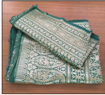
ภาพที่ 2.14 ผ้านุ่งหรือภูษา