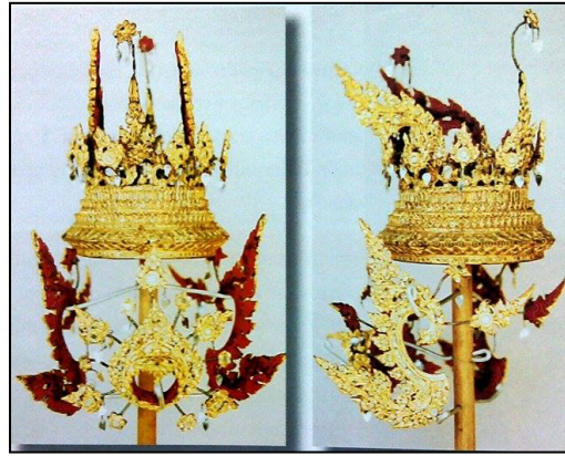
ภาพที่ 2.7 รัตเกล้าเปลว