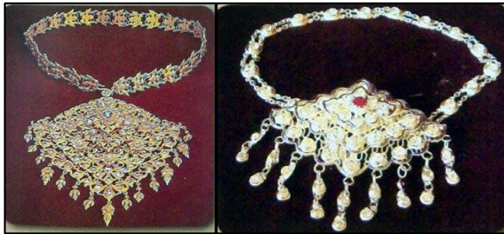
ภาพที่ 2.9 ทับทรวงพระ (ซ้าย) และจี๋นาง (ขวา)

2.1) ทับทรวง เป็นเครื่องประดับคอหรืออก ทำโครงเป็นรูปทรงสี่เหลี่ยม รูปว่าว (เมื่อแขวนคอ ด้านที่มีความยาวเรียวยาวจะอยู่ข้างล่าง) ประดับด้วยเพชรพลอยเป็นชั้น ๆ ภายในตัวเรือนโปร่ง ถ้าเป็นเครื่องประดับของนางเรียกว่า จี๋นาง ดังภาพต่อไปนี้