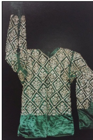
ภาพที่ 2.15 เสื้อพระแบบแขนยาว

3.3) เสื้อ โบราณตัดเป็นเสื้อคอกลมผ่าหน้า ตัวเสื้อไม้เว้าวงแขน ต่อแขนแบบต่อตรง เสริมเป้าสี่เหลี่ยมไต้รักแร้ทั้งแบบแขนยาวและแขนสั้น แต่ปัจจุบันตัดเป็นเสื้อสำเร็จรูป คอกลม เว้าวงแขน ทั้งแบบแขนยาวและแขนสั้น ในสมัยโบราณมีข้อกำหนดใน การใช้แตกต่างกันคือ ในชนใช้แขนยาวที่มีสีตัวเสื้อกับสีแขนเสื้อต่างกัน ส่วนในละครำใช้แขนยาวที่มีสีเดียวกันทั้งตัว (เรื่องเดียวกัน, 2550, หน้า 121) ดังภาพต่อไปนี้