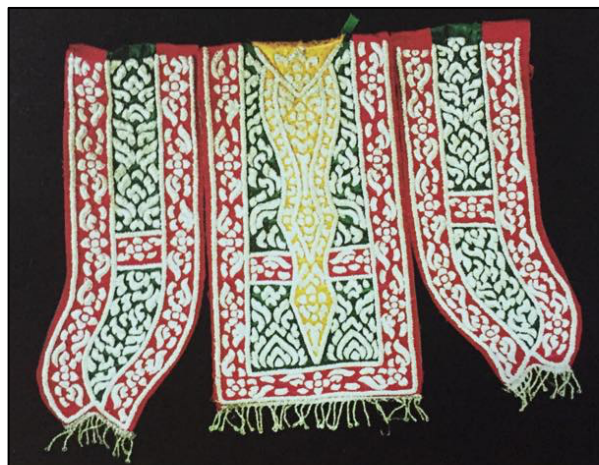
ภาพ 2.17 ชายไหวชายแครง

3.5) ชายไหวและชายแครง ชายไหวหรือผ้าห้อยหน้า อยู่ในระหว่างชายแครง(ห้อยข้าง) สองข้าง เป็นผ้าสี่เหลี่ยมทั้งสามชิ้น ความยาว 21 นิ้ว มีการปักเป็นลวดลายเข้าชุดกันกับรัตสะเวย ชายไหว ชายแครงทั้งสองอย่างนี้ถือเป็นเครื่องต้นสำหรับแต่งองค์พระมหากษัตริย์โดยเฉพาะ ได้มีพระราชกำหนดห้ามมิให้นำขึ้นแต่งกายโขน ละคร ความประสงค์ในการที่มี ชายไหวหรือผ้าห้อยหน้านั้นเข้าใจว่า เพื่อเป็นการปกปิดชายพกของตัวละครที่หลังจากแต่งแล้ว จะมีด้ายที่เย็บเสื่อ ชายเสื่อ ขอบผ้าถุงหรือผ้าคาดเอวเกะกะมัดรวบรวมกันไว้เป็นชายพกข้างหน้า แล้วปิดด้วยชายไหวหรือผ้าห้อยหน้าให้เรียบร้อย ดังภาพต่อไปนี้