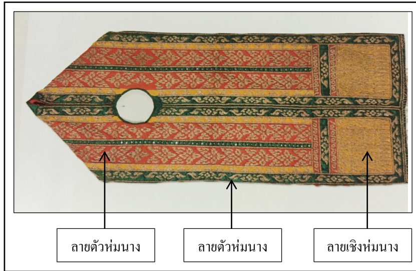
ภาพที่ 2.16 ผ้าห่มนาง