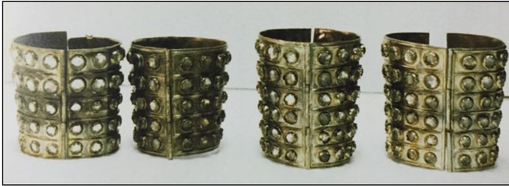
ภาพที่ 2.11 ทองกรหรือกำไลแฉง ที่มา: เรื่องเดียวกัน (2550, หน้า 131)

2.3) ทองกรหรือกำไลแฉง มีลักษณะเป็นแผ่นโลหะทองหรือเงินกลมรอบข้อมือ มีรอยเชื่อมต่อคล้ายกับบานพับปิด-เปิดได้ข้างหนึ่ง อีกข้างหนึ่งมีรูที่สามารถใช้เหล็กเสียบรูเพื่อเชื่อมต่อให้ติดกันตามรูปข้อมือเวลาสวมใส่ประดับด้วยเพชรพลอยสวยงาม บางทีอาจใช้ผ้าต่วนหรือผ้าแพรตัดเป็นรูปลักษณะเหมือนกัน คือเป็นผืนผ้าสี่เหลี่ยมปักดินหรือเลื่อมหรือประดับด้วยเพชรพลอยด้วยก็ได้ใช้สวมแทนกำไลแฉง ดังภาพต่อไปนี้