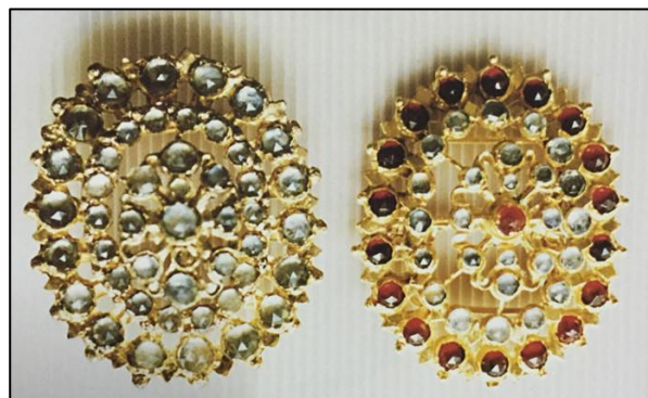
ภาพที่ 2.10 หัวเข็มขัดหรือปิ่นเหน่ง

2.2) เข็มขัด หัวเข็มขัดหรือปิ่นเหน่ง สำหรับโขนละครตัวเอกจะทำอย่างประณีตบรรจง มีการประดับเพชร พลอย สวยงาม ถ้าเป็นตัวรองก็ใช้เข็มขัดทองเหลืองกะไหล่ทองมีหัวพลอยประดับ ภายหลังประดิษฐ์ด้วยผ้าแพรหรือผ้าต่วนปิดล้อมใช้กับตัวละครระดับรอง ๆ ลงมาอีก ดังภาพต่อไปนี้