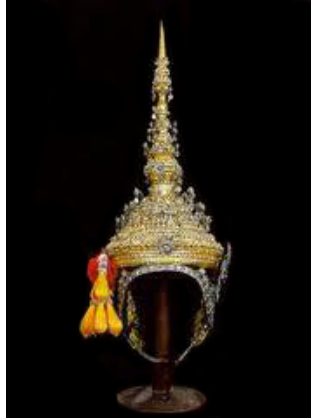
ภาพที่ 2.2 ชฎาพระ