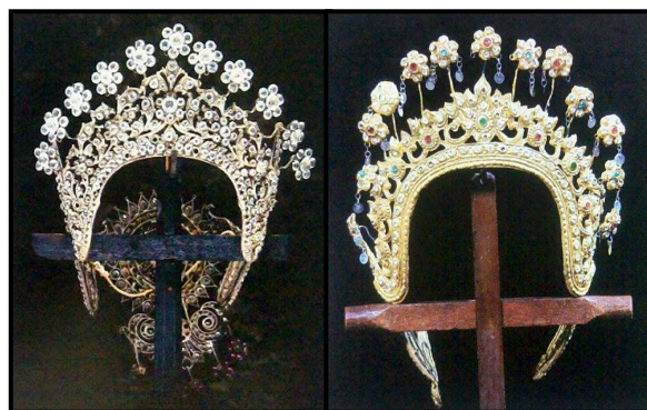
ภาพที่ 2.8 กระบังหน้าเงินประดับพลอย (ซ้าย) และกระบังหน้าทองประดับพลอย (ขวา)

1.6) กระบังหน้า หรือศรีเพศ หรือเศียรเพศ เป็นศิราภรณ์รองมีใช้มาตั้งแต่สมัยอยุธยา ผู้ใช้กระบังหน้าจะเป็นลูกหลานที่เกิดจากนางสนมหรือหลานหลวงชั้นเอก สุวรรณมาลาเป็นศิราภรณ์ที่เป็นต้นแบบของกระบังหน้าที่ใช้ในละครของกรมศิลปากร ใช้สำหรับตัวนางกำนัลหรือนางสนม กระบังหน้าทำด้วยหนังฉลุลายติดตัวกระบังลงรักปิดทองมีกรรเจียกจร ทัดอุบะดอกไม้ที่จอนหูซ้าย กระบังหน้านี้มีทั้งเงินประดับพลอยและหนังลงรักปิดทองประดับพลอย กระบังหน้าเงินประดับเพชรที่มีใช้ในปัจจุบันจะใช้คู่กับรัดท้ายช่องโดยรวบผมหางม้าไว้ด้านหลัง รัตหางม้านี้ด้วยรัดท้ายช่อง บางโอกาสก็มุ่นหางม้าเป็นมวยใส่เกล้ารัตผมมวยแล้วปักปิ่น ส่วนใหญ่ใช้กับตัวละครที่มีบทบาทเป็นตัวละครสำคัญของเรื่อง หรือเป็นตัวเอกของละคร นอกจากนี้ยังใช้สำหรับตัวละครที่มีอายุน้อย เป็นพระธิดา เป็นโอรส เป็นต้น ทัดอุบะดอกไม้ที่จอนหูซ้ายถ้าเป็นตัวนาง ที่จอนหูขวาถ้าเป็นตัวพระ (กรมศิลปากร, 2547, หน้า 195) ดังภาพต่อไปนี้