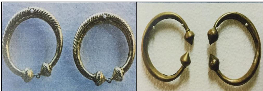
ภาพที่ 2.12 กำไลเท้า ที่มา: เรื่องเดียวกัน (2550, หน้า 130)

2.4) กำไลเท้า เป็นเครื่องประดับสำหรับสวมข้อเท้าทำด้วยเงินหรือทองหรือกะไหล่ทองหรือทองเหลืองกะไหล่ทองหรืออาจใช้ผ้าแพรผ้าต่วนหรือผ้ากำมะหยี่ปักดินและเลื่อมทำเป็นแผ่นทาบรัดข้อเท้าแทนสวมกำไลเท้า ดังภาพต่อไปนี้