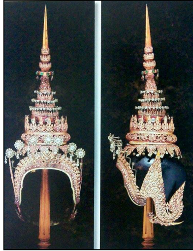
ภาพที่ 2.5 เกี้ยวยอด

1.4) เกี้ยวยอด เป็นเครื่องประดับศีรษะโขนละครของฝ่ายนางที่มีมาแต่ดั้งเดิม มีลักษณะเป็นเครื่องประดับสำหรับสวมศีรษะที่ทำเลียนแบบตามลักษณะในภาพเขียน ประกอบด้วยส่วนที่ขึ้นหูนด้วยกระดาศาอัดแข็งเป็นโครงใส่ครอบศีรษะ ทาสีดำตัดด้วยเส้นขาวเป็นเส้นแบ่งตามแนวผมปัก ดังภาพต่อไปนี้