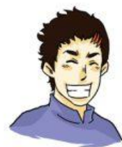
มีความสุข