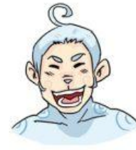
มีความสุข