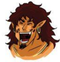
มีความสุข