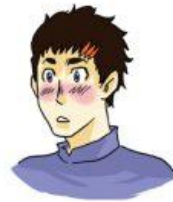
ตกหลุมรัก