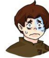
หวาดกลัว