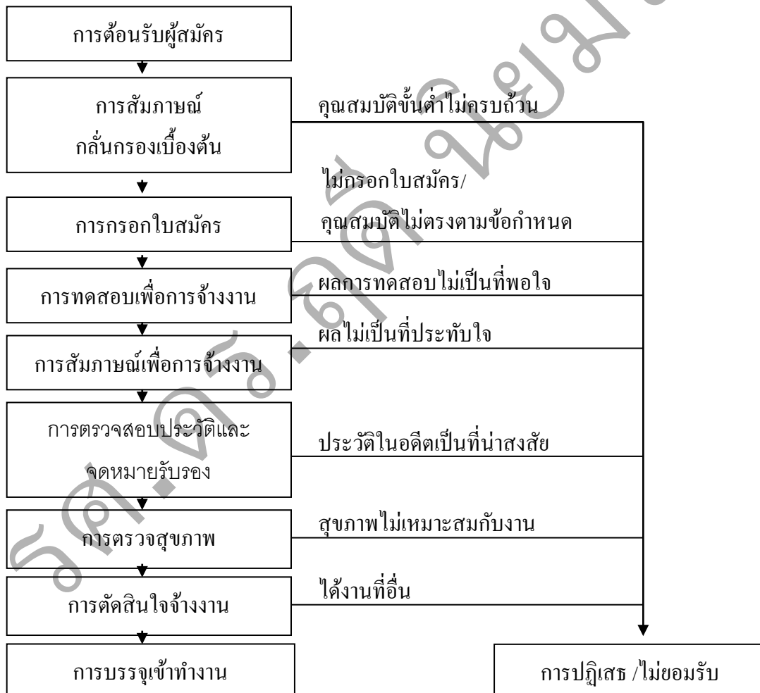
ภาพที่ 4.2 กระบวนการคัดเลือกบุคลากร ที่มา (สุนันทา เลहनันท์, 2542, หน้า 155; อ้างอิงจาก De Cenzo & and Stephen P., nd., p. 173)

2.2 กระบวนการคัดเลือกบุคลากร หลังจากที่คุณดำเนินการสรรหาได้ดำเนินการเพื่อจูงใจให้บุคคลที่มีความรู้ความสามารถสมัครงานในตำแหน่งต่างๆ ตามที่องค์กรประกาศรับแล้ว กิจกรรมขั้นต่อไปเป็นการคัดเลือกเพื่อกลั่นกรองบุคคลที่มีคุณสมบัติครบตามเกณฑ์และปฏิเสธบุคคลที่ขาดคุณสมบัติที่เหมาะสม กระบวนการคัดเลือกบุคลากรจึงประกอบด้วย 8 ขั้นตอน ซึ่งเป็นกิจกรรมที่ปฏิบัติอย่างต่อเนื่อง กล่าวคือถ้าผู้สมัครคนใดผ่านขั้นตอนที่ 1 ได้ก็จะได้เข้าสู่ขั้นตอนที่ 2 และ 3 ต่อไปจนครบทุกขั้นตอน แต่หากผู้สมัครไม่สามารถผ่านขั้นตอนใดขั้นตอนหนึ่งไปได้อาจถูกปฏิเสธออกจากกระบวนการคัดเลือก อย่างไรก็ตามการลำดับขั้นตอนของกระบวนการคัดเลือกแต่ละองค์การอาจแตกต่างกัน ความสัมพันธ์ของกระบวนการทั้ง 8 ขั้นตอนแสดงในภาพที่ 4.2 และมีรายละเอียดดังต่อไปนี้ (สุนันทา เลहनันท์, 2542, หน้า 156 – 160)