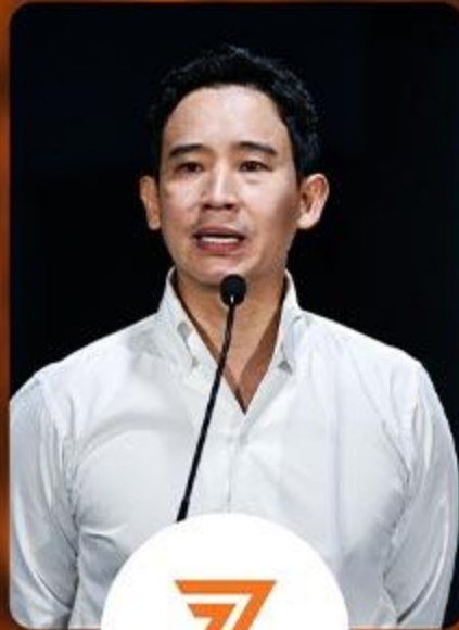
พรรคก้าวไกล