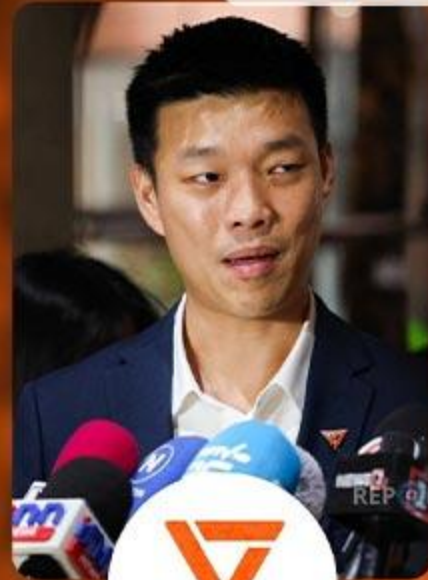
พรรคประชาชน