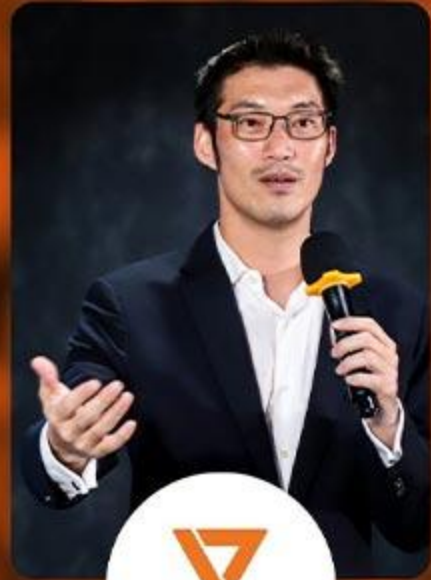
อนาคตใหม่