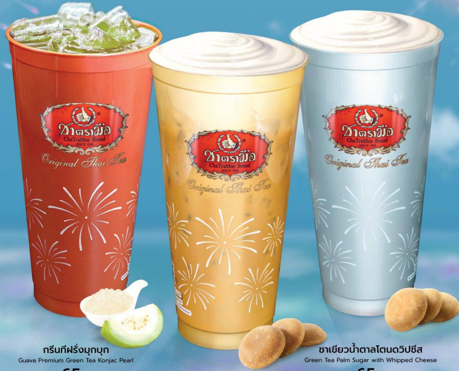
กรีนทีฝรั่งบุกบุก Guava Premium Green Tea Konjac Pearl