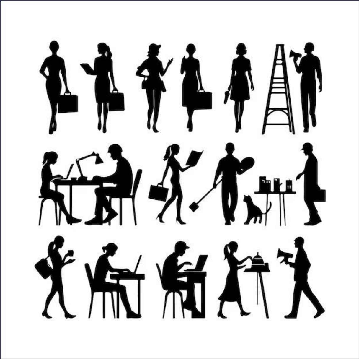
Event งานหนึ่งไม่ใช่คนเดียว แต่คือ ecosystem