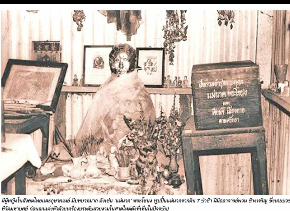
ผีผู้หญิงในสังคมไทยและอุษาคเนย์ มีบทบาทมาก ดังเช่น 'แม่นาค' พระโขนง (รูปปั้นแม่นาคจากดิน 7 ป้าชา มีมืออาจารย์พวน ช่างเจี๊ยะ ซึ่งเคยบวชที่วัดมหาบุศย์ ก่อนถูกแต่งตั้งด้วยเครื่องประดับสวยงามในศาลใหม่ตั้งที่เห็นในปัจจุบัน)