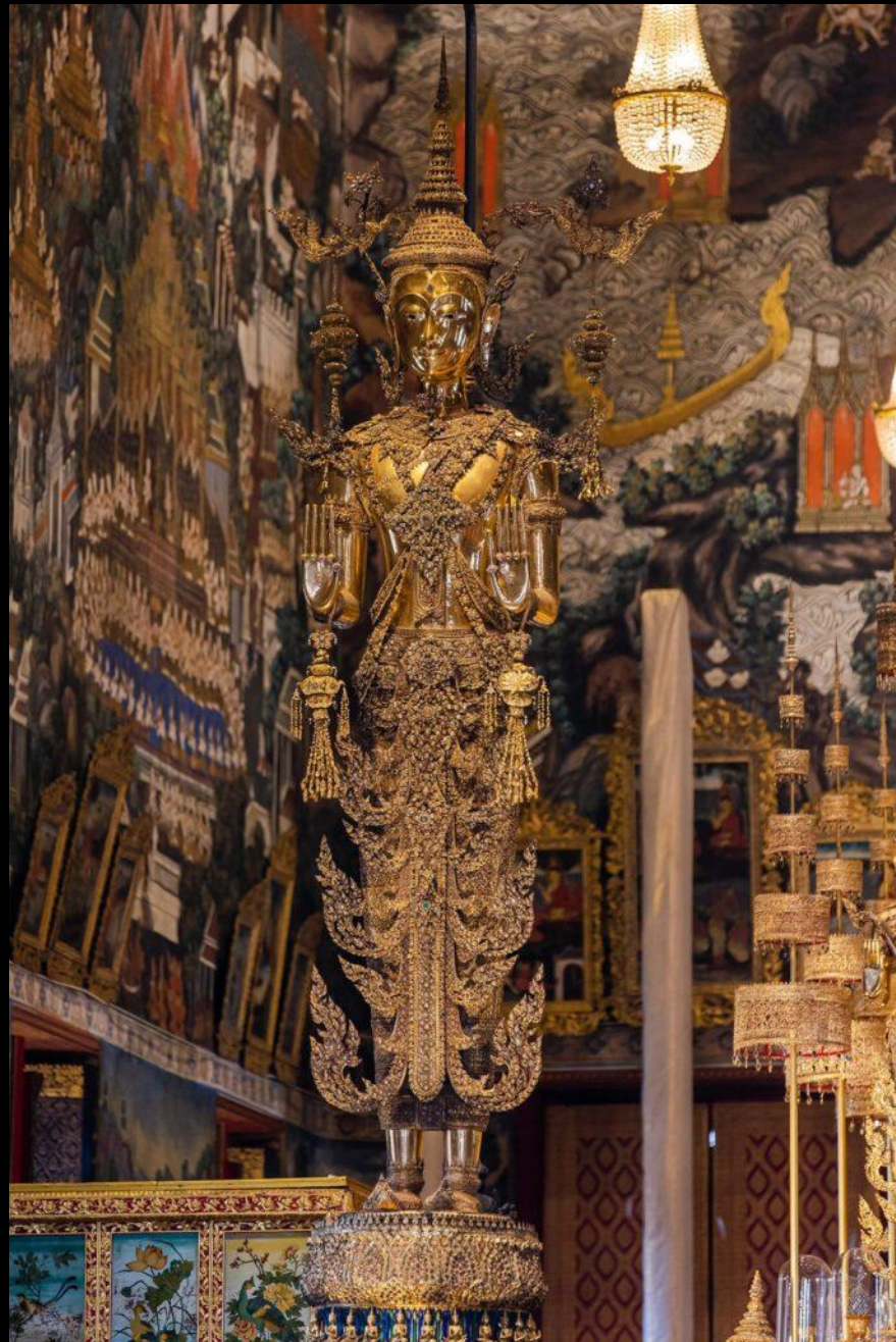
พระพุทธรูปอดพ้าจุฬาลงโลก ประดิษฐานอยู่เบื้องซ้าย พระแก้วมรกต