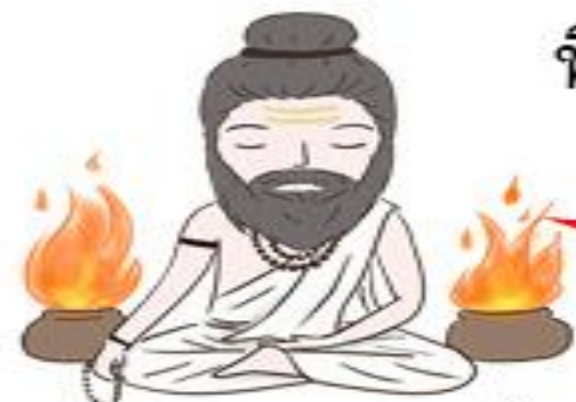
วรรณพราหมณ์ กำเนิดจาก "ปาก"