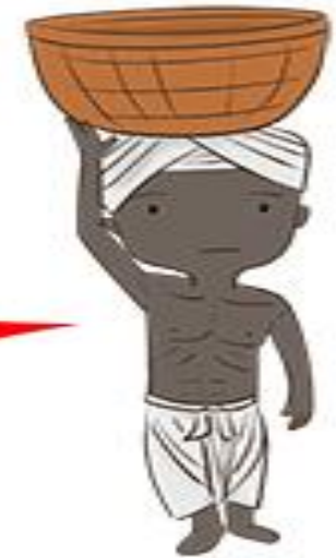
วรรณะศูทร กำเนิดจาก "เท้า"