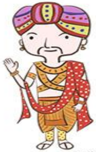
วรรณแพศย์ (ไวยชยะ) กำเนิดจาก "ต้นขา"