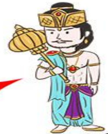
วรรณะกษัตริย์ กำเนิดจาก "แขน"